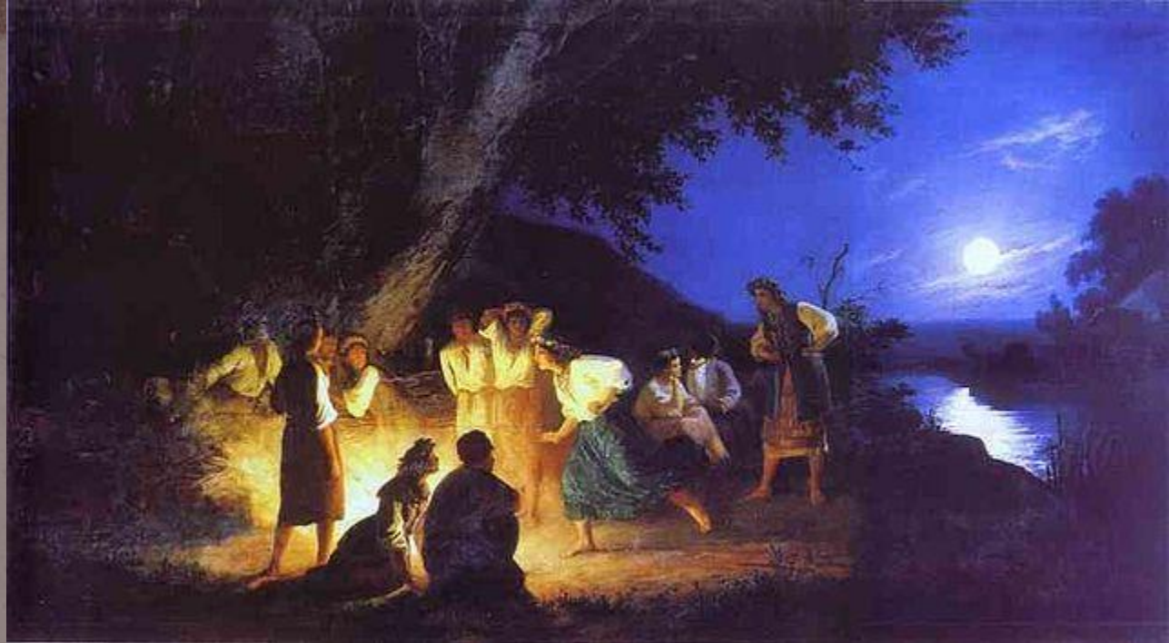
Генрих Ипполитович Семирадский

по православному календарю день Иоанна Крестителя . Но обряды этого праздника более древние, чем христианство. Накануне праздника наши предки, по традиции, гадали, прыгали через костер, купались и искали клады. Назывался праздник – Иван Купала .