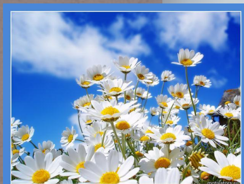
Ромашка-это цветок который борется за любовь,до последнего лепестка..