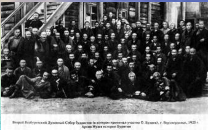
Второй Всебуурятский Духовный Собор буддистов (в котором приняла участие О. Будаска), г. Верхнеудинск, 1925 г. Архив Музея истории Бурятии