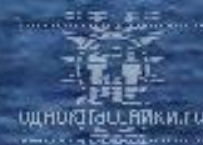
Бегущая по волнам.