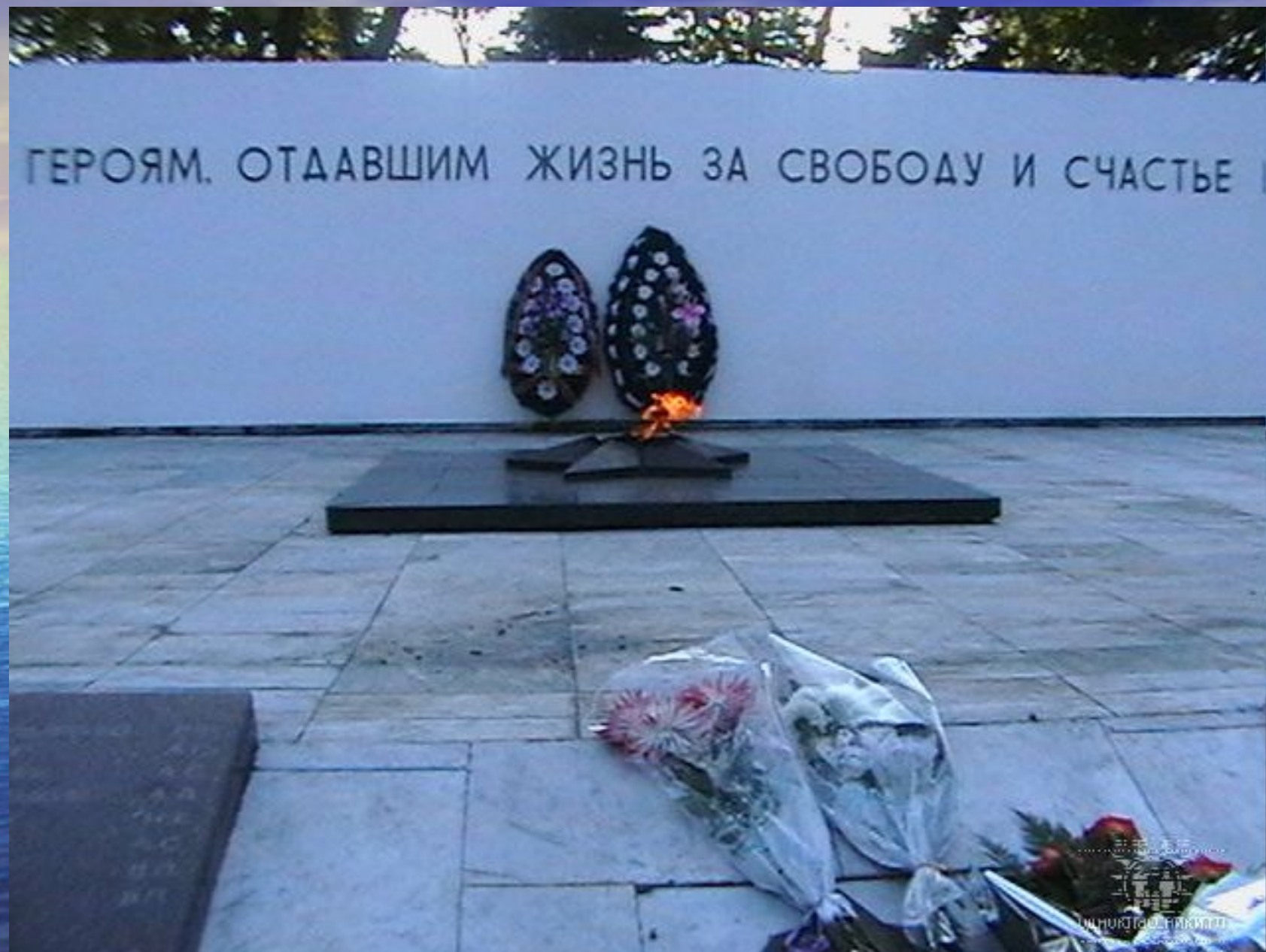
У вечного огня.