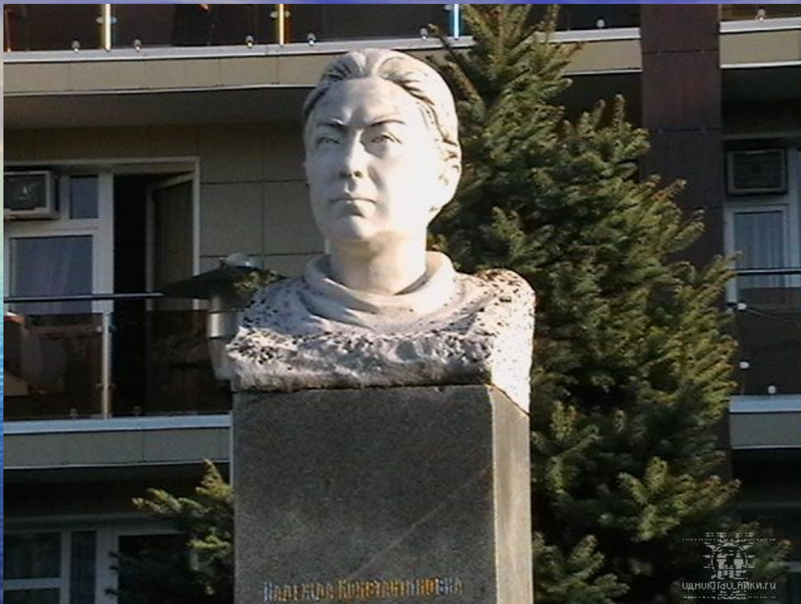
Надежда Константиновна Крупская.