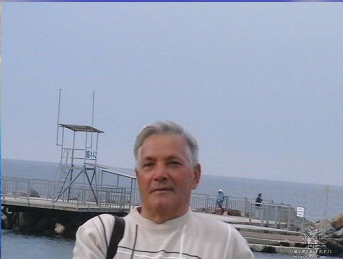
Это я, на пляже «Высокий берег».