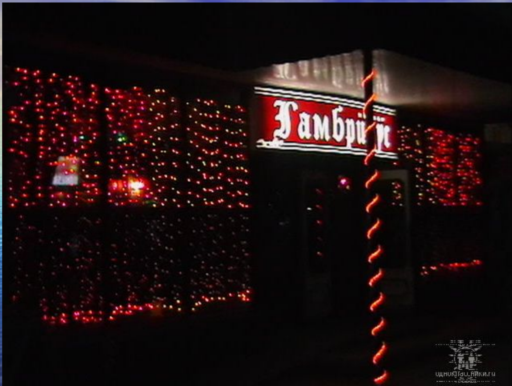
Вечерний город Анапа.