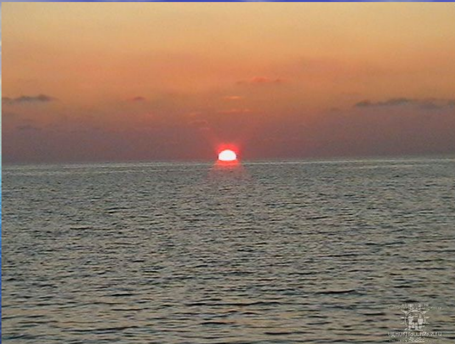
Закат над морем.