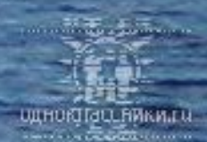
Прогулка по морю.