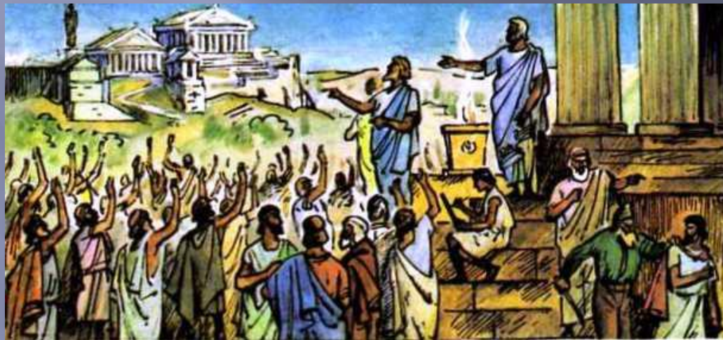
Народное собрание в Древних Афинах