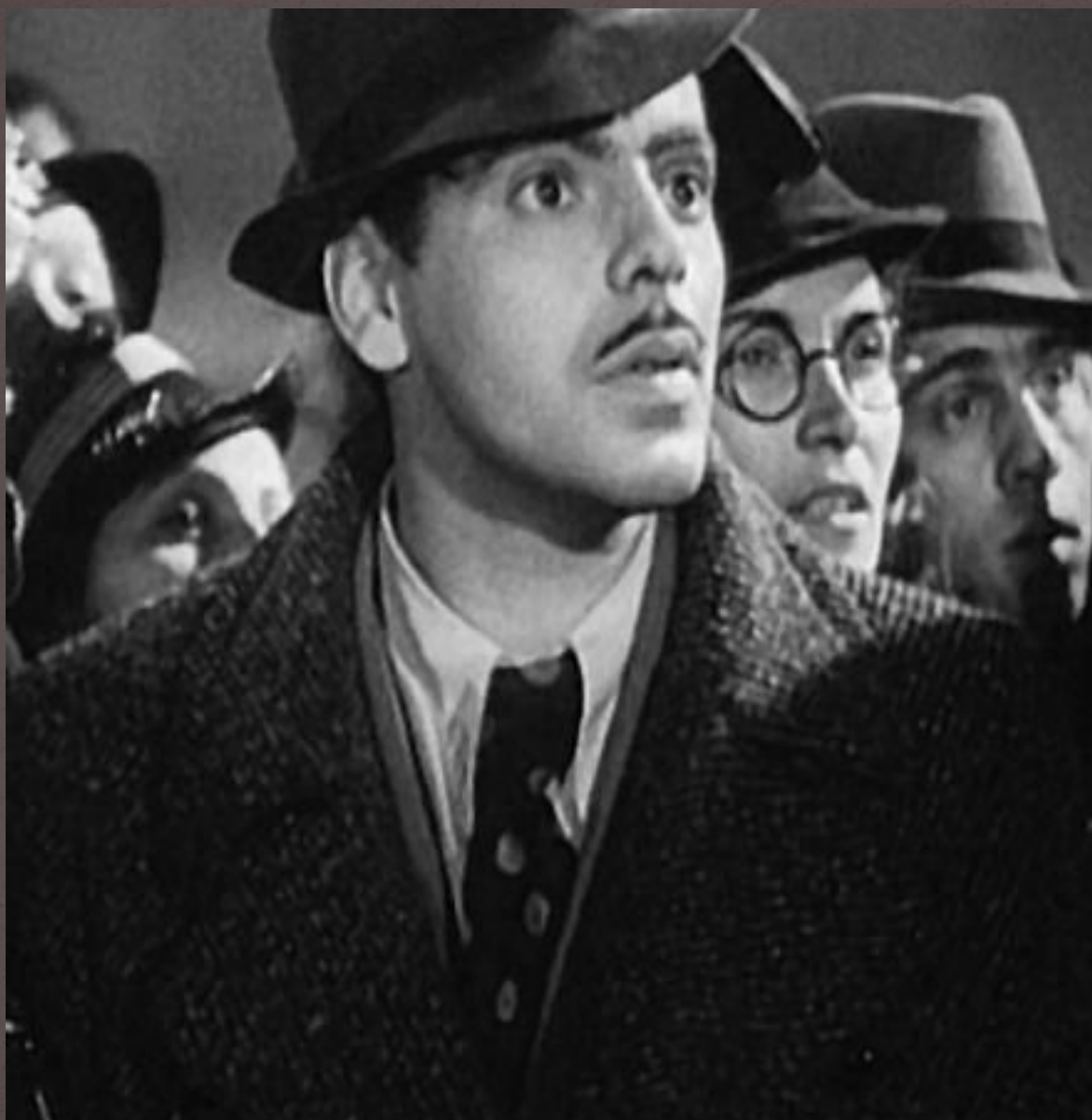
Валерий Чкалов" (1941) , роль американского журналиста.