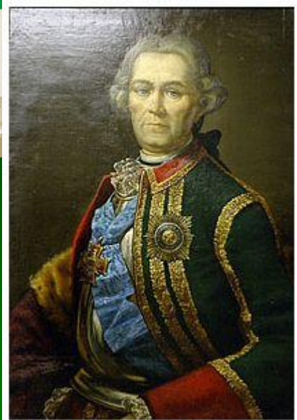
Миних Христофор Антонович