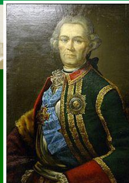
Миних Христофор Антонович