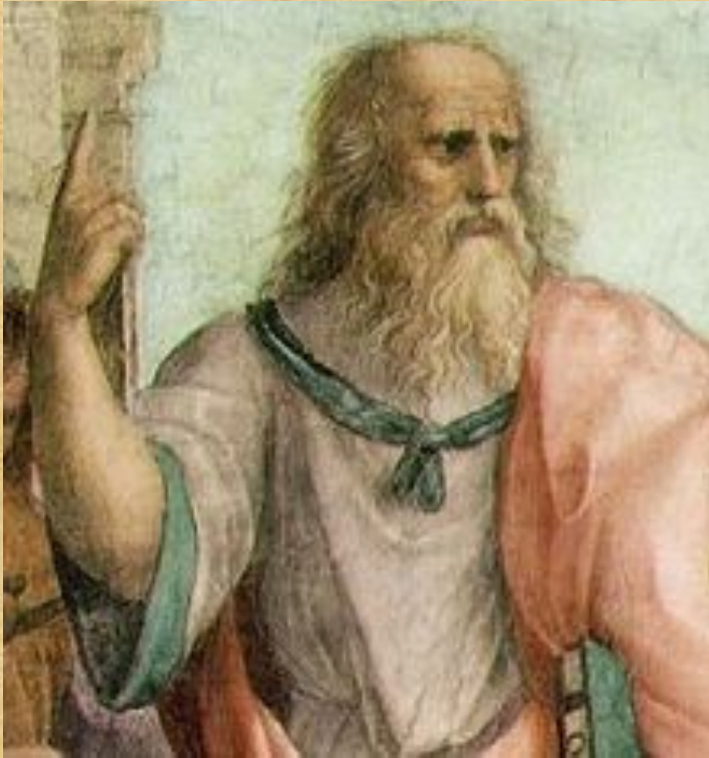
Платон на фреске «Афинская школа»