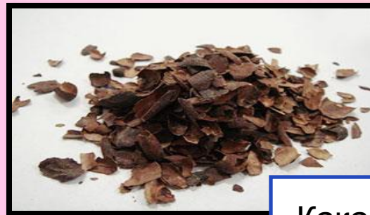
Какао-велл – шелуха какао бобов

Можно ли отличить настоящую шоколадку от сладкой плитки в магазине? Оказывается, можно. Большинство производителей честно указывают состав, надо только правильно читать этикетки. Если в составе шоколада указан растительный жир или содержание какао-порошка больше 4%, перед вами не шоколад, а сладкая плитка. Помните: какао-порошок могут спрятать под названием "какао-велл".