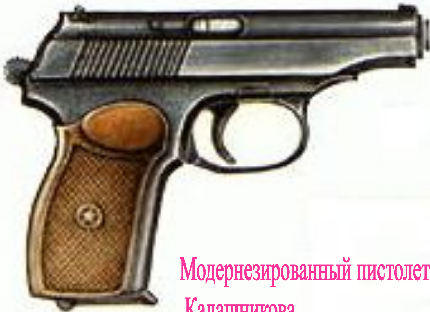
Модернезированный пистолет Калашникова