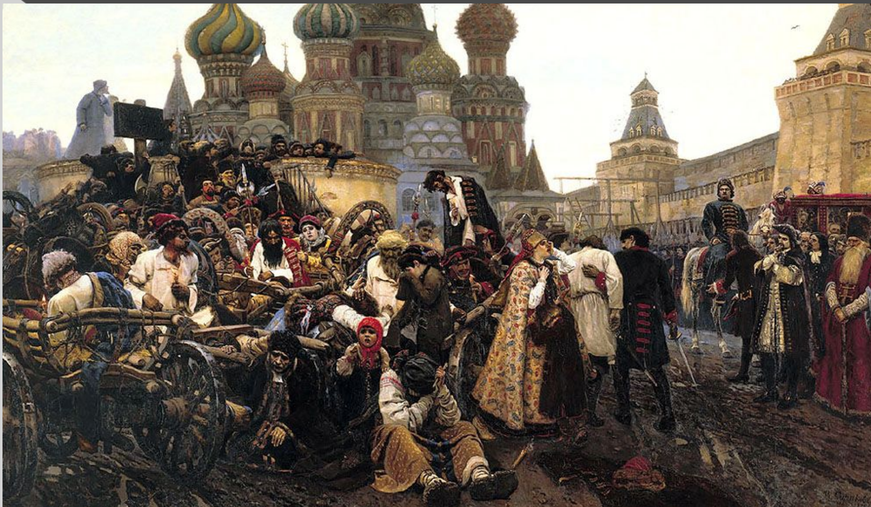
В.И.Суриков. «Утро стрелецкой казни»