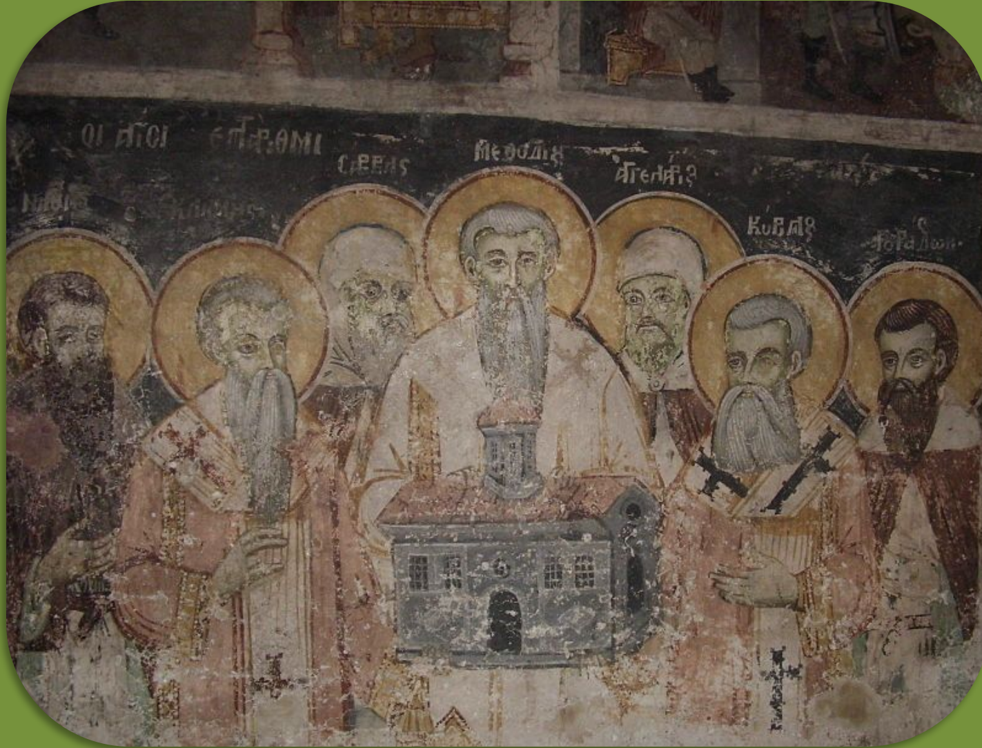
Фреска монастыря «Святой Наум»(в Республике Македонии).