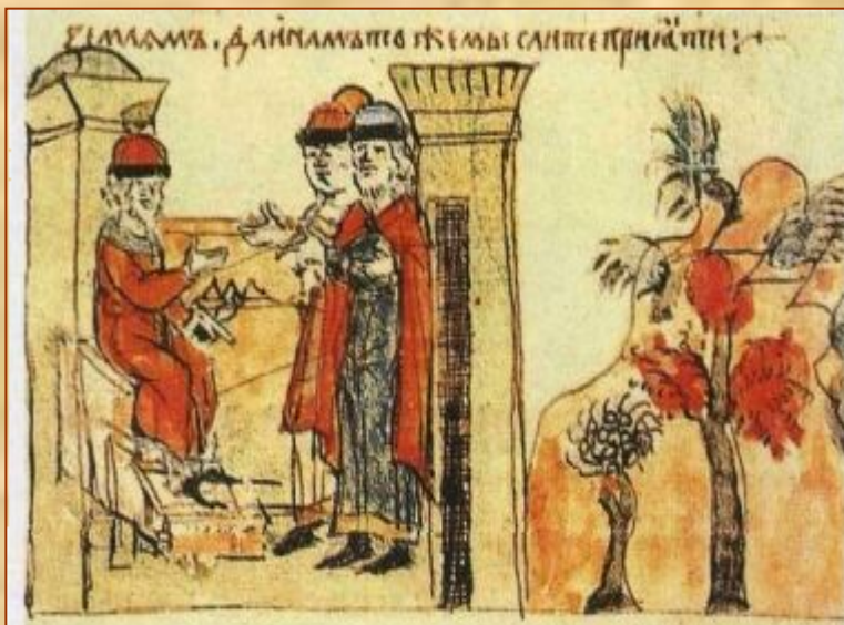
Изложение князю Владимиру своей веры хазарами