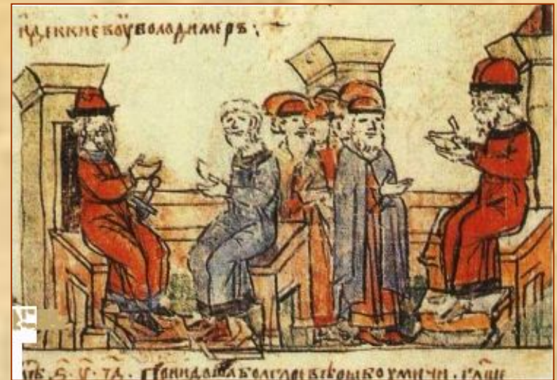
Изложение своей веры князю Владимиру мусульманами