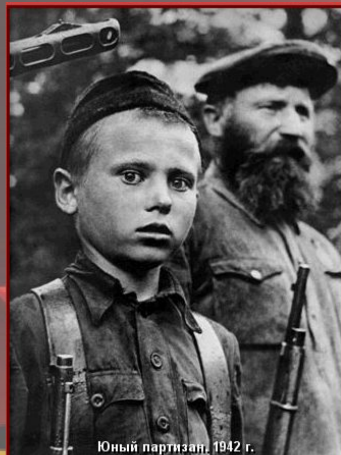
Юный партизан, 1942 г.

В серьезной степени героизм солдат и командиров сорвал планы немецкого наступления. Уже летом 41-го года были полностью сорваны планы наступления немецкой армии. Потом были Сталинград, Курск, Московская битва, но все они стали возможны благодаря беспримерному мужеству простого советского солдата.