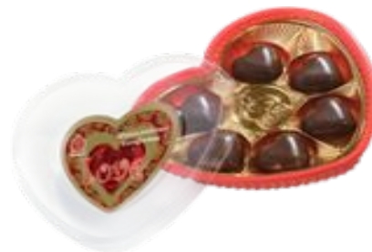
Конфеты «Изысканность», 50 г