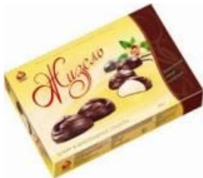
зефир глазированный , 250 г