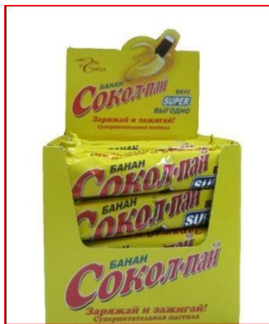
Пастила «Сокол-Пай» глазированная с ароматом банана, 35 г (количество в шоубоксе – 32 шт.)