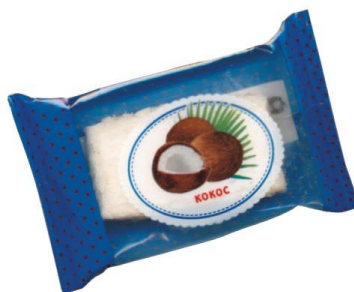
Пастила с ароматом кокоса, 4 кг