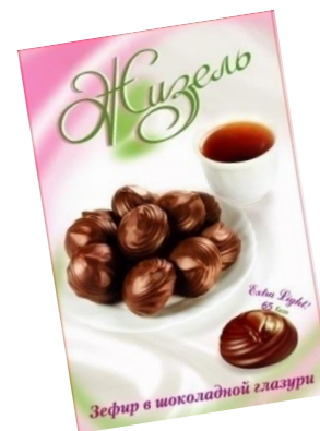
зефир глазированный, 180 г