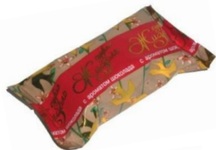
Суфле с ароматом шоколада, 2 кг