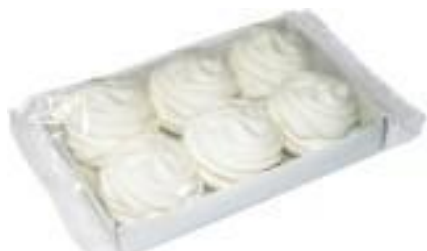
зефир с ароматом сливок, 260 г (на пектине)