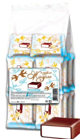
Суфле с ароматом пломбира, 200г (пакет)