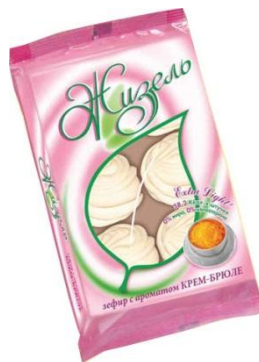
зефир с ароматом крем-брюле, 250г (на пектине)