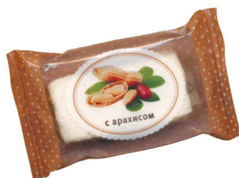
Пастила с арахисом, 5 кг