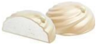
зефир в йогуртовой глазури, 2,5 кг