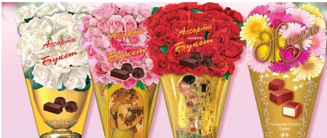
Конфеты Ассорти «Букет», 150 г