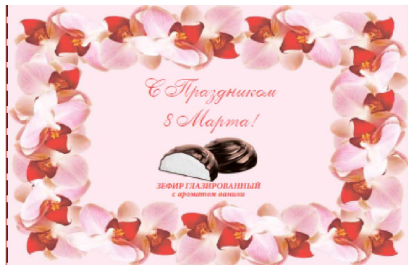
Зефир «Жизель» глазированный с ароматом ванили, 250 г (коробка с 8 марта)