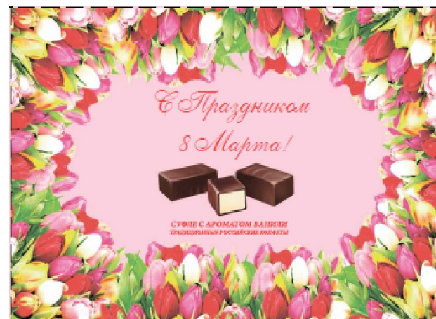
Конфеты суфле «Жизель» с ароматом ванили, 200 г (коробка с 8 марта)