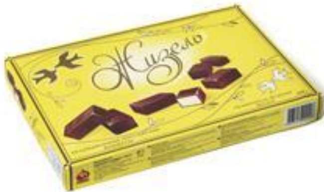
Суфле с ароматом ванили, 200г (картон)