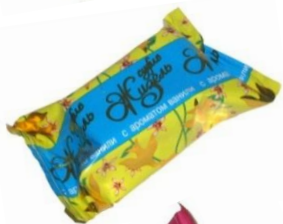
Суфле с ароматом ванили, 2кг