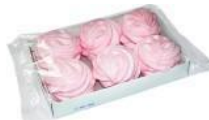
зефир с ароматом лесной ягоды, 260г (на пектине)