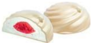
зефир в йогуртовой глазури с фруктовой начинкой, 2,5 кг