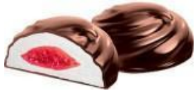
зефир глазированный с фруктовой начинкой, 2,5 кг