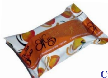
Суфле с персиковым мармеладом, 3 кг