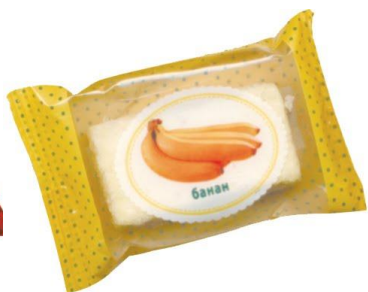
Пастила с ароматом банана, 4 кг