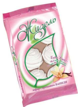
зефир с ароматом ванили, 260г (на пектине)