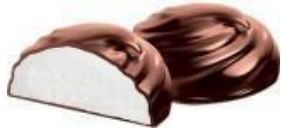
зефир глазированный с ароматом ванили, 2,5 кг