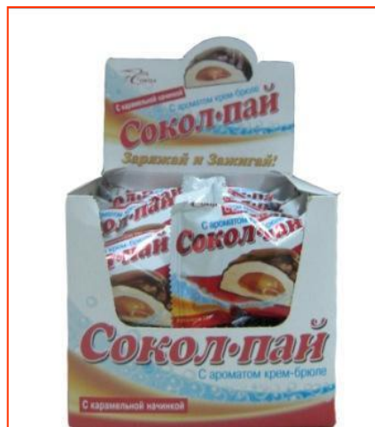
Зефир «Сокол-Пай» Глазированный с ароматом крем-брюле с «вареной сгущенкой», 25 г (количество в шоубоксе – 24 шт.)