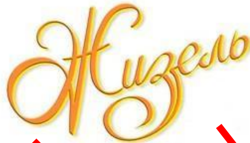
Шоколадные конфеты суфле