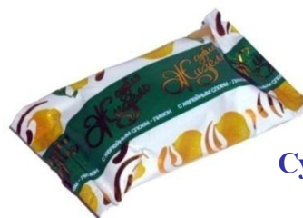
Суфле с лимонным мармеладом, 3 кг