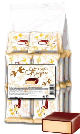
Суфле с ароматом крем-брюле, 200г (пакет)