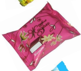
Суфле с ароматом ванили, 2 кг