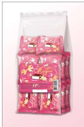
Суфле с ароматом ванили, 200г (пакет)