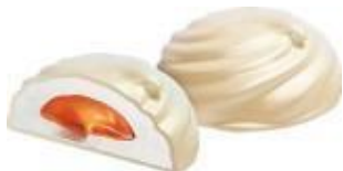
зефир в йогуртовой глазури с «вареной сгущенкой», 2,5 кг