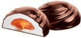
зефир глазированный с «вареной сгущенкой», 2,5 кг