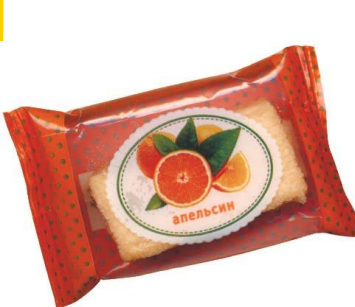
Пастила с ароматом апельсина, 4 кг