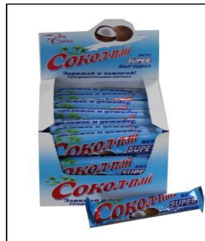
Пастила «Сокол-Пай» глазированная с ароматом кокоса, 40 г (количество в шоубоксе – 28 шт.)