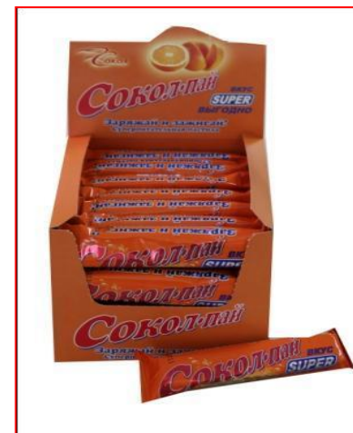
Пастила «Сокол-Пай» глазированная с ароматом кокоса, 40 г (количество в шоубоксе – 28 шт.)