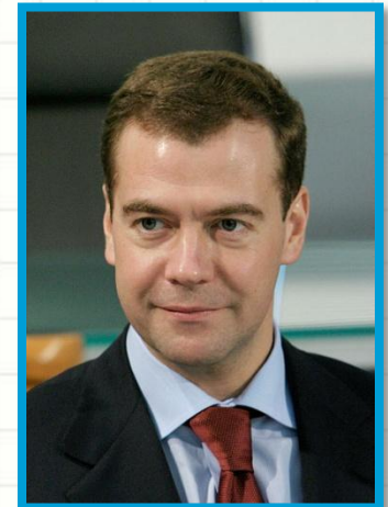
Д.А. Медведев с 7 мая 2008 г. действующий