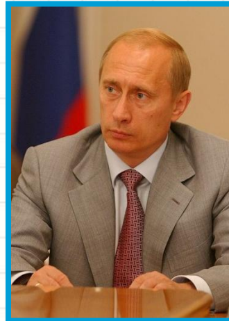
В.В. Путин И.о. с 31 декабря 1999 по 7 мая 2000 с 7 мая 2000 г. по 7 мая 2008 г.