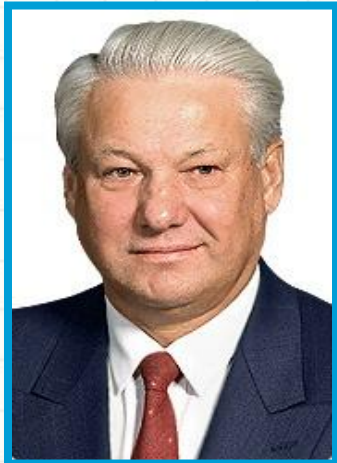
Б.Н. Ельцин с 10 июля 1991 г. по 31 декабря 1999 г.