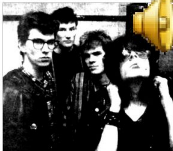
THE SISTERS OF MERCY

Субкультура готиков сформировалась вокруг жанра готик-рок, одного из ответвлений новой волны. Основные группы этого жанра сформировались в конце 70-х — начале 80-х. Группы первой волны готик-рока — Sisters of Mercy, Bauhaus, Siouxsie & the Banshees, The Cure, Joy Division — были тесно связаны с панк-роком[3][7]. Однако от панка их отличали существенные музыкальные особенности: более медленный ритм исполнения, меньшая тяжесть, минорная мелодика. Многие группы (например, Sisters of Mercy) использовали драм-машины вместо живых ударных.