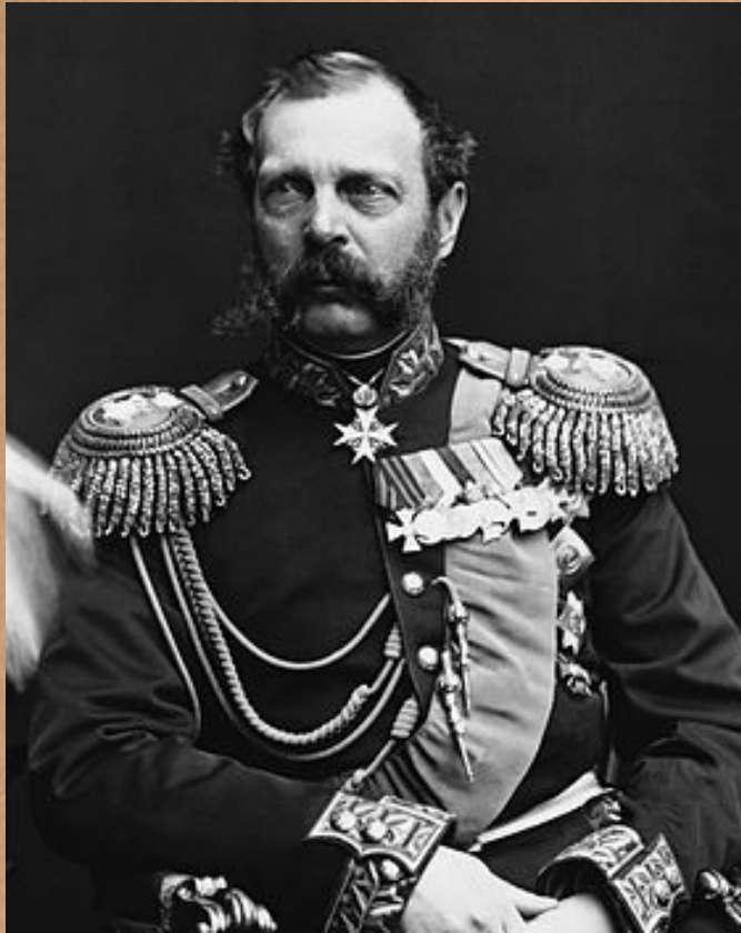
Александр II Николаевич

В середине 19 века значительные шаги в направлении конституционного правления были сделаны в царствование императора Александра II: отмена крепостного права, судебная реформа, развитие земства.