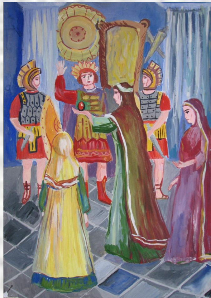
“Пришествие Марии Магдалины к Тиберию”.