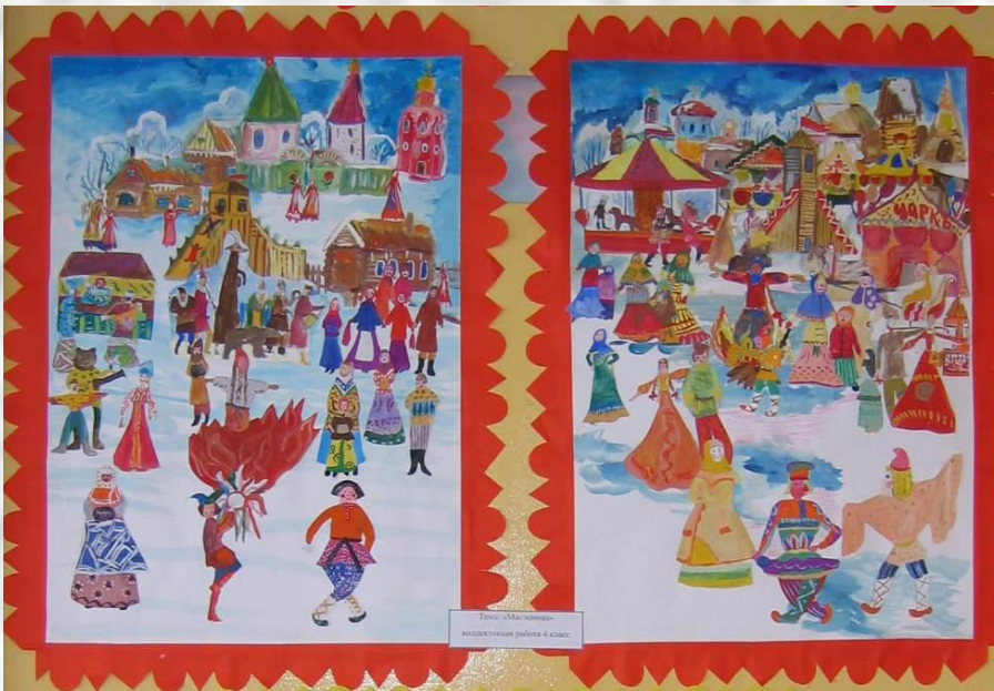
Тема: «Масленица» коллективная работа 4 класс

Сохраняется веселье, нарядные одежды, подарки, вкусная еда, песни, пляски и обычаи многие из которых мы знаем, помним и хотим продолжать!