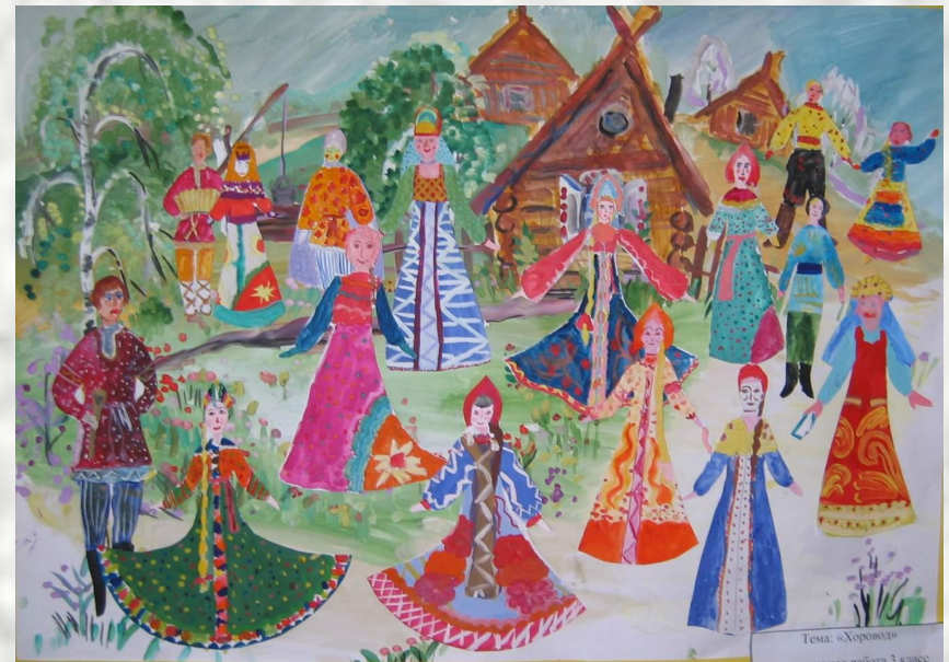
Тема: «Хоровод» коллективная работа 3 класс

Коллективные работы учащихся начальной школы.