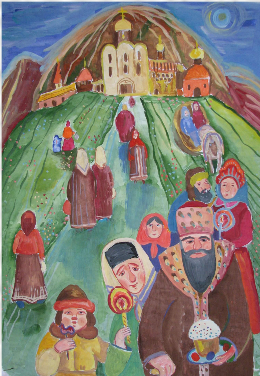
“Дорога в храм в Пасхальный день”