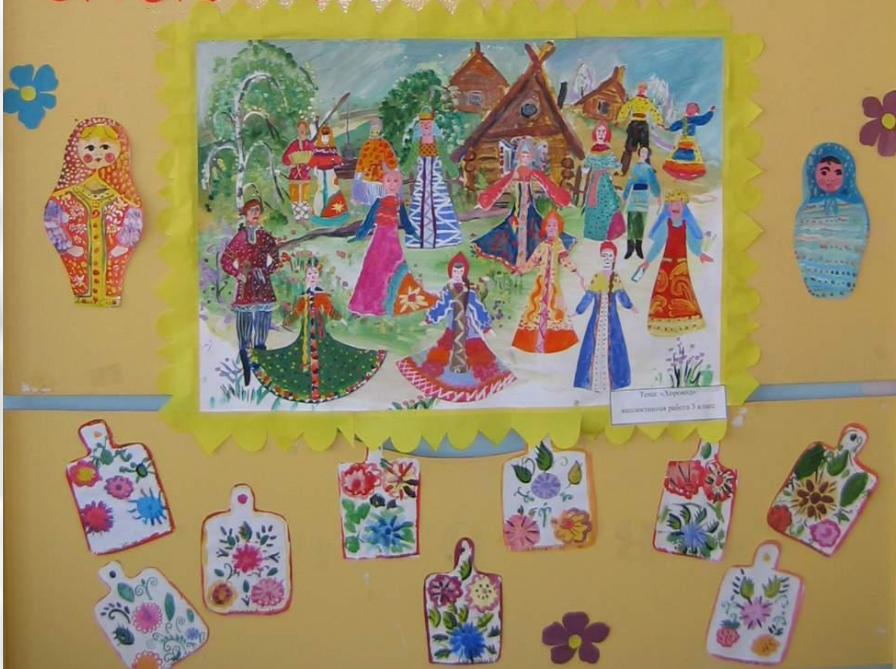
Тема: «Хоровод» коллективная работа 3 класс