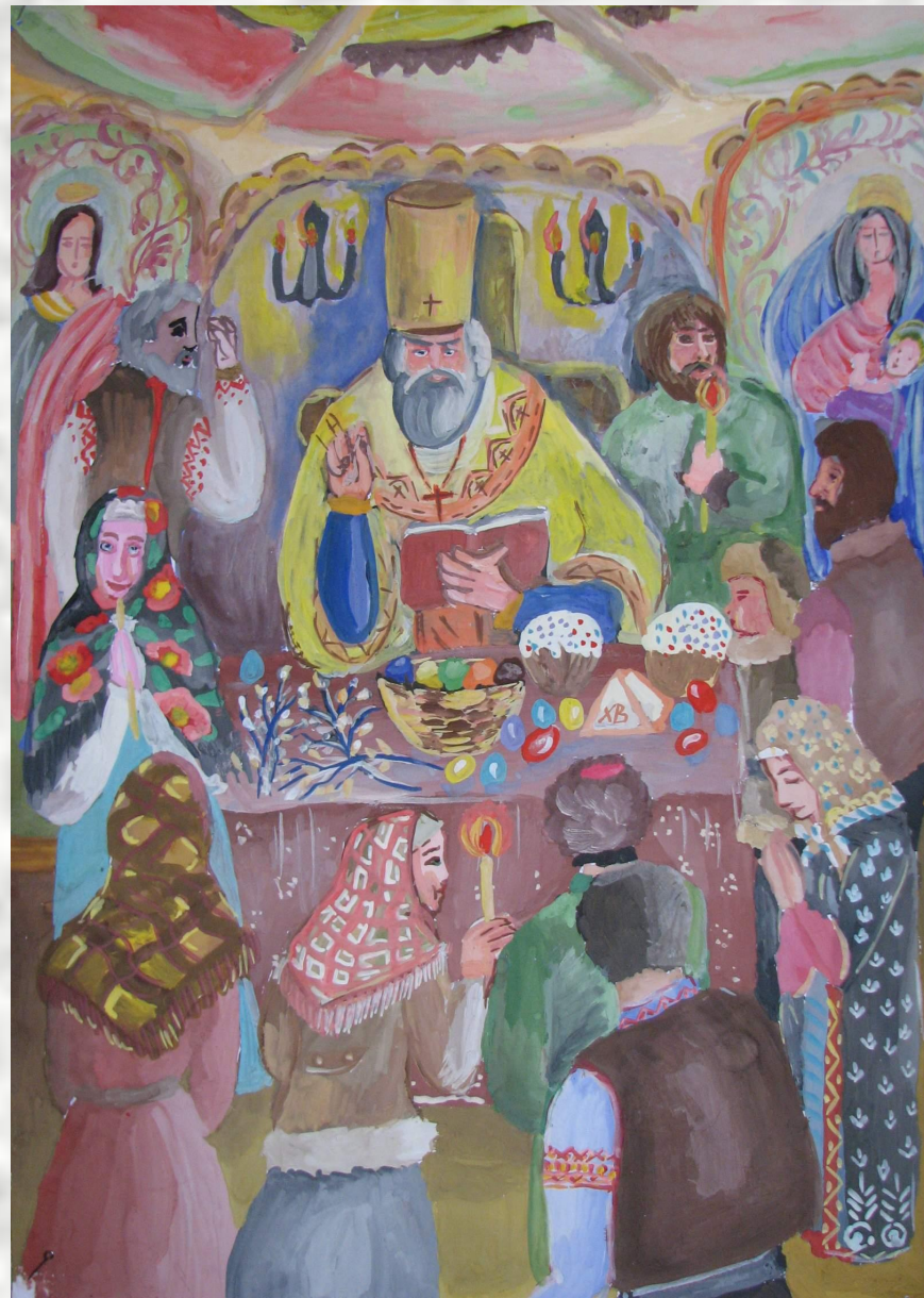
“Освящение приношений в Покровском соборе”