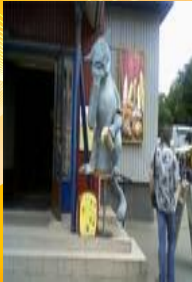
Вход в кафе «Ешкин кот»