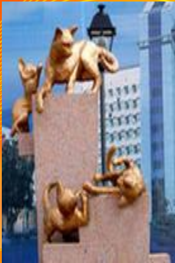
Памятник подопытной кошке в Красноярске