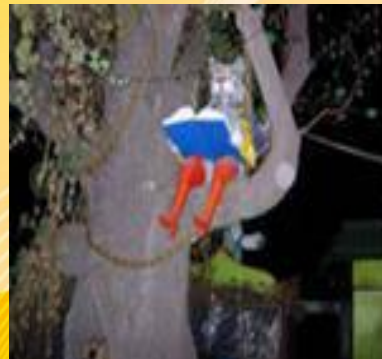
Кот ученый. Ростов-на-Дону.