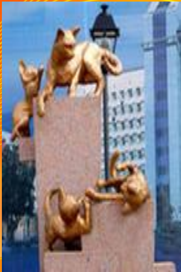
Памятник подопытной кошке в Красноярске