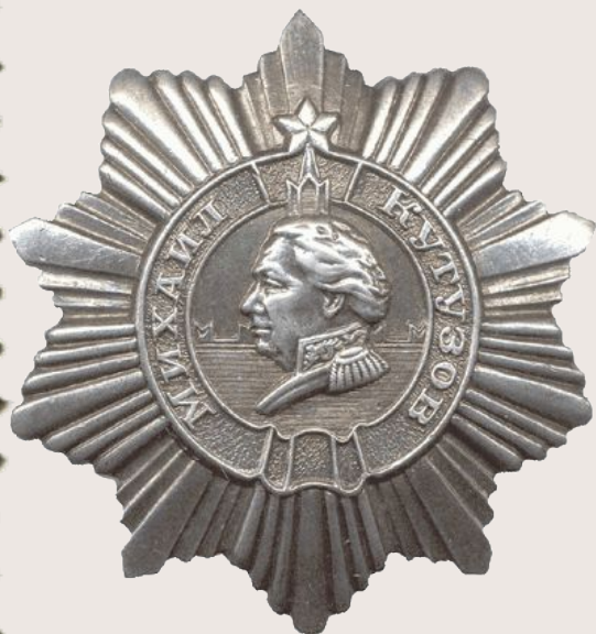
Орден Михаила Кутузова 3-й степени