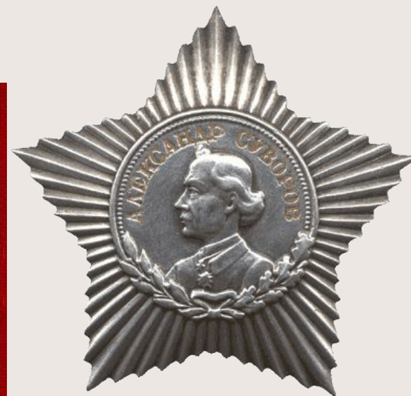
Орден Александра Суворова 3-й степени