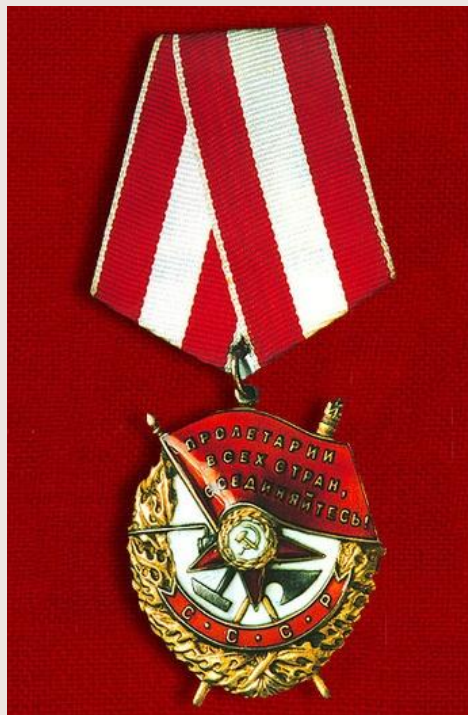
Орден Красного Знамени