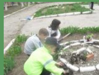
Ухаживание за посевами