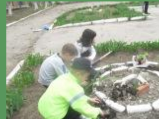
Ухаживание за посевами