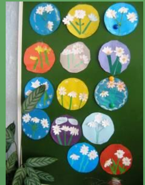
Выставка «Цветы приносят радость»