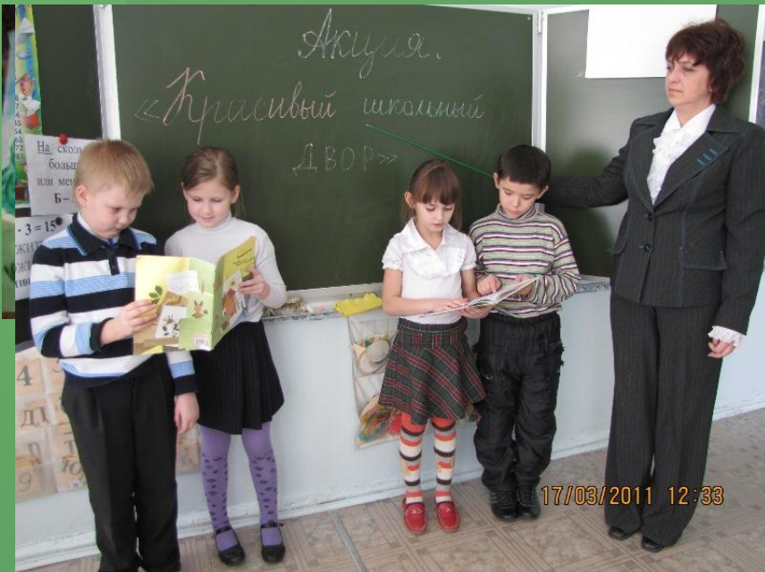
«Значение растений в нашей жизни»