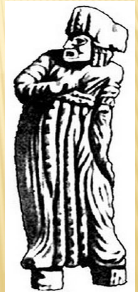
Актер на котурнах