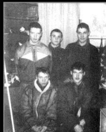
Самая опасная банда новокузнецких киллеров, задержанная в 1995 году. (а на вид, обычные парни из «качалки», таких в толпе не заметишь)