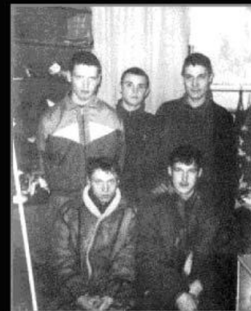
Самая опасная банда новокузнецких киллеров, задержанная в 1995 году. (а на вид, обычные парни из «качалки», таких в толпе не заметишь)