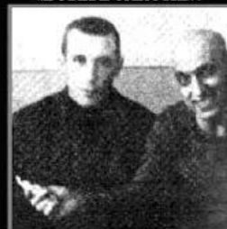
С ними придется «делиться»