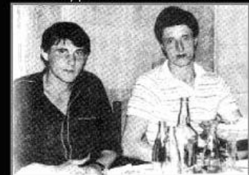
Трудно поверить, что за свою невероятную жестокость эти люди получили кличку «шакаль».