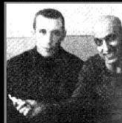
С ними придется «делиться»