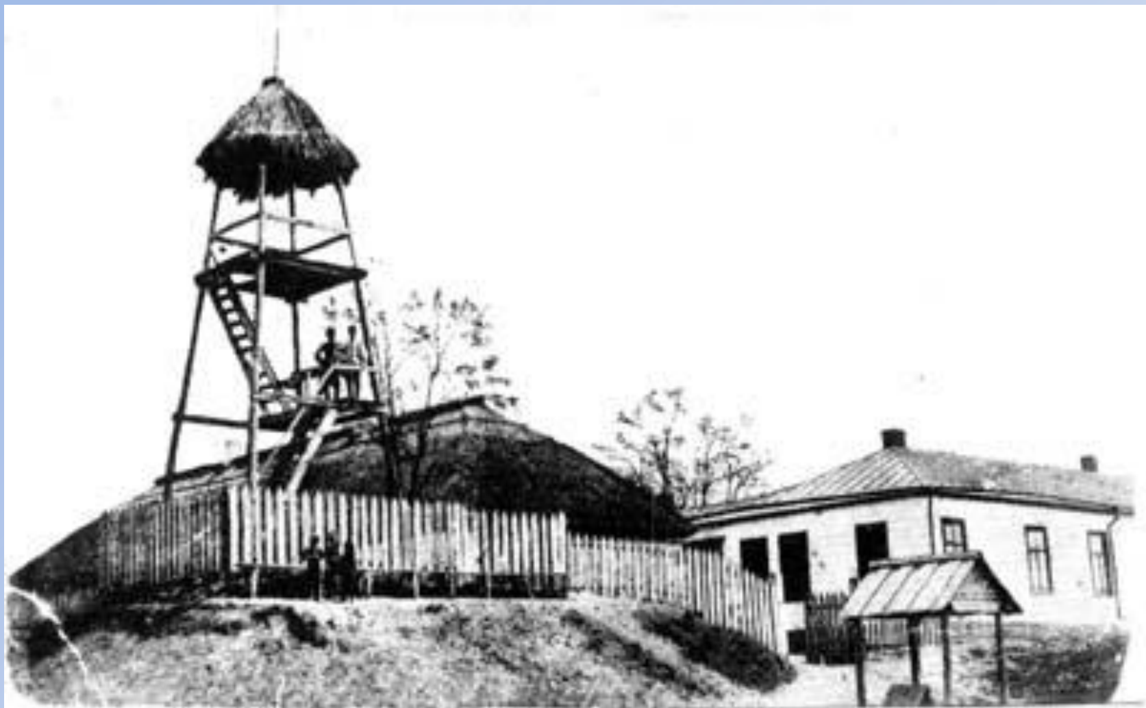
Фото 70-х гг. XIX в.

Сторожевая вышка, стоявшая на месте современного кинотеатра Аврора.