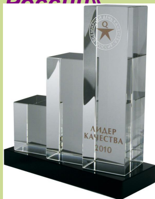
Приз «Лидер качества».