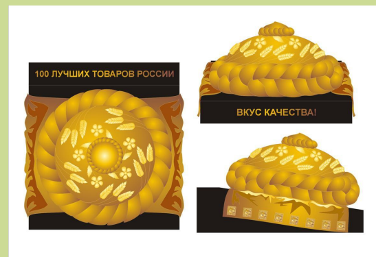
Приз «Вкус качества»

Почетный знак «ЗА ДОСТИЖЕНИЯ В ОБЛАСТИ КАЧЕСТВА»