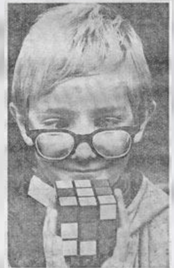
Favourite toy . . . a young Rubik cube fan