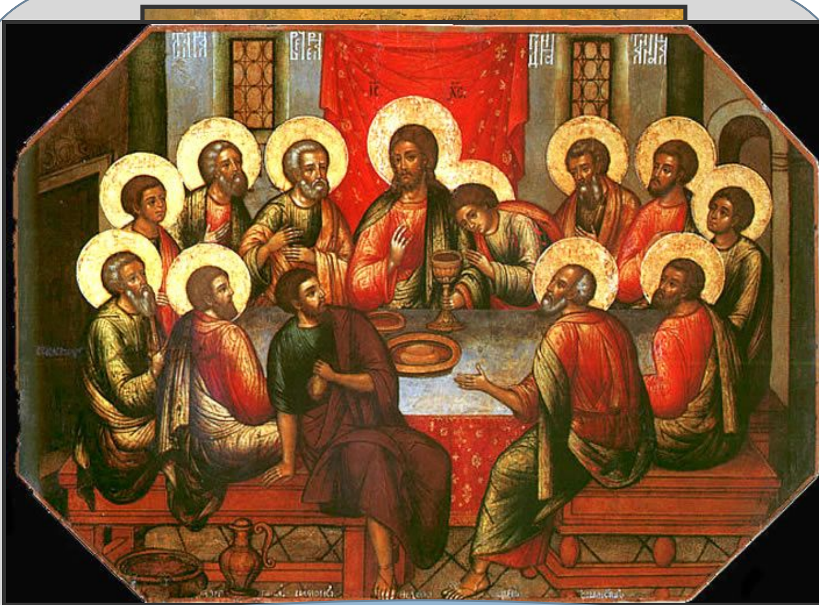
Симон Ушаков. «Тайная вечеря». Икона XVII века