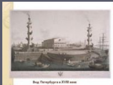
Вид Петербурга в XVIII веке

В память о великом ученом в здании Кунсткамеры (в первом ярусе башни) был открыт (в 1949) музей М. В. Ломоносова. В музее воссоздана обстановка конференц-зала Академии наук, представлены личные вещи ученого.