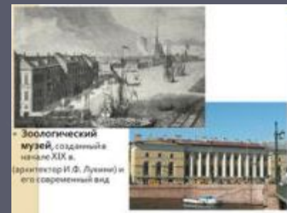
Зоологический музей, созданный в начале XIX в. (архитектор И.Ф. Лукин) и его современный вид