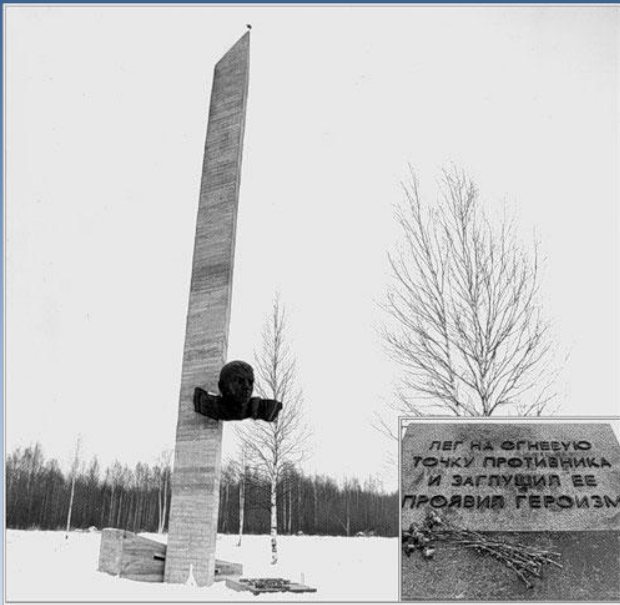
Место подвига А.Матросова