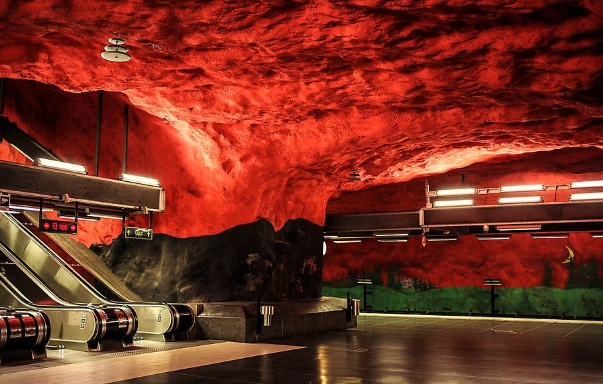
Станция "Сольна" в Стокгольме