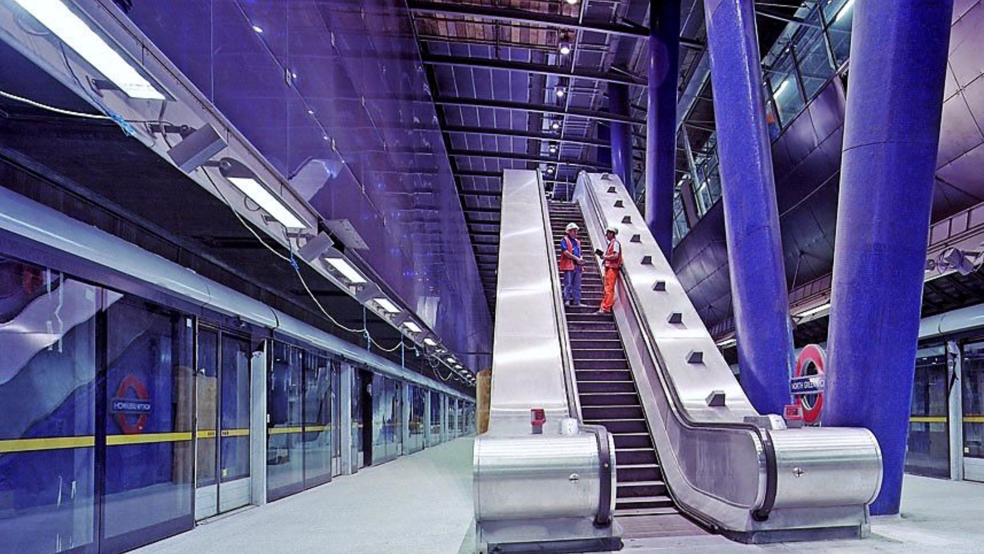
Станция "Норт-Гринвич" в Лондоне