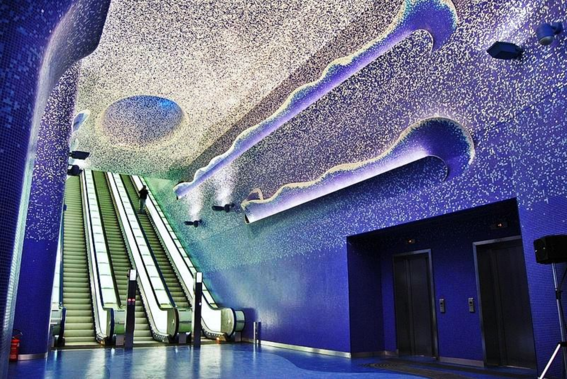
Станция "Толедо" в Неаполе