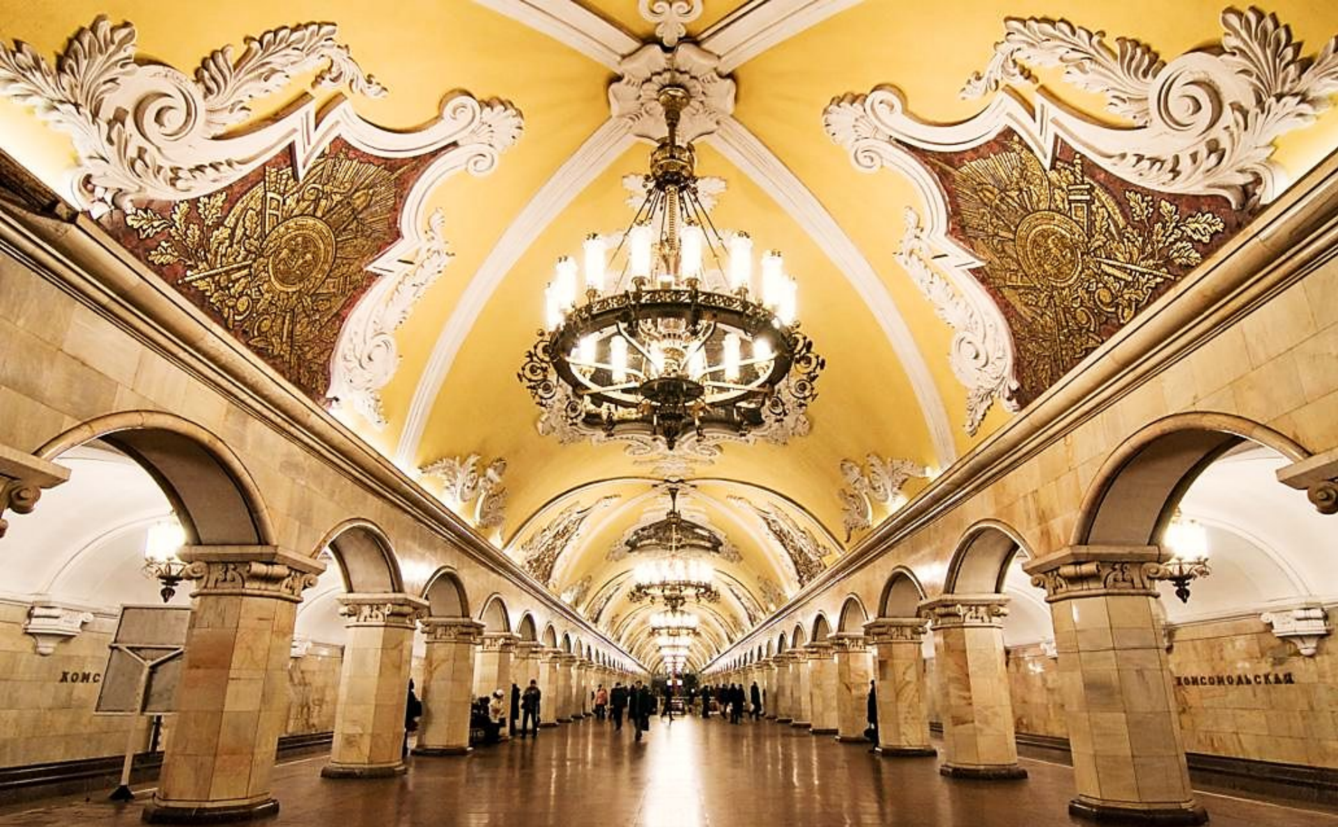
Станция "Комсомольская" в Москве