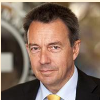
Петер Маурер президент