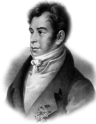
Николай Гнедич (1784-1833) Первый переводчик Гомера в России. В 1829г. издал лучший перевод «Илиады»