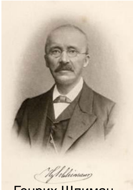
Генрих Шлиман (1822-1890) немецкий археолог. Большую часть жизни посвятил изучению жизни Гомера и раскопкам Трои, Микен, Орхомена, Тирифа