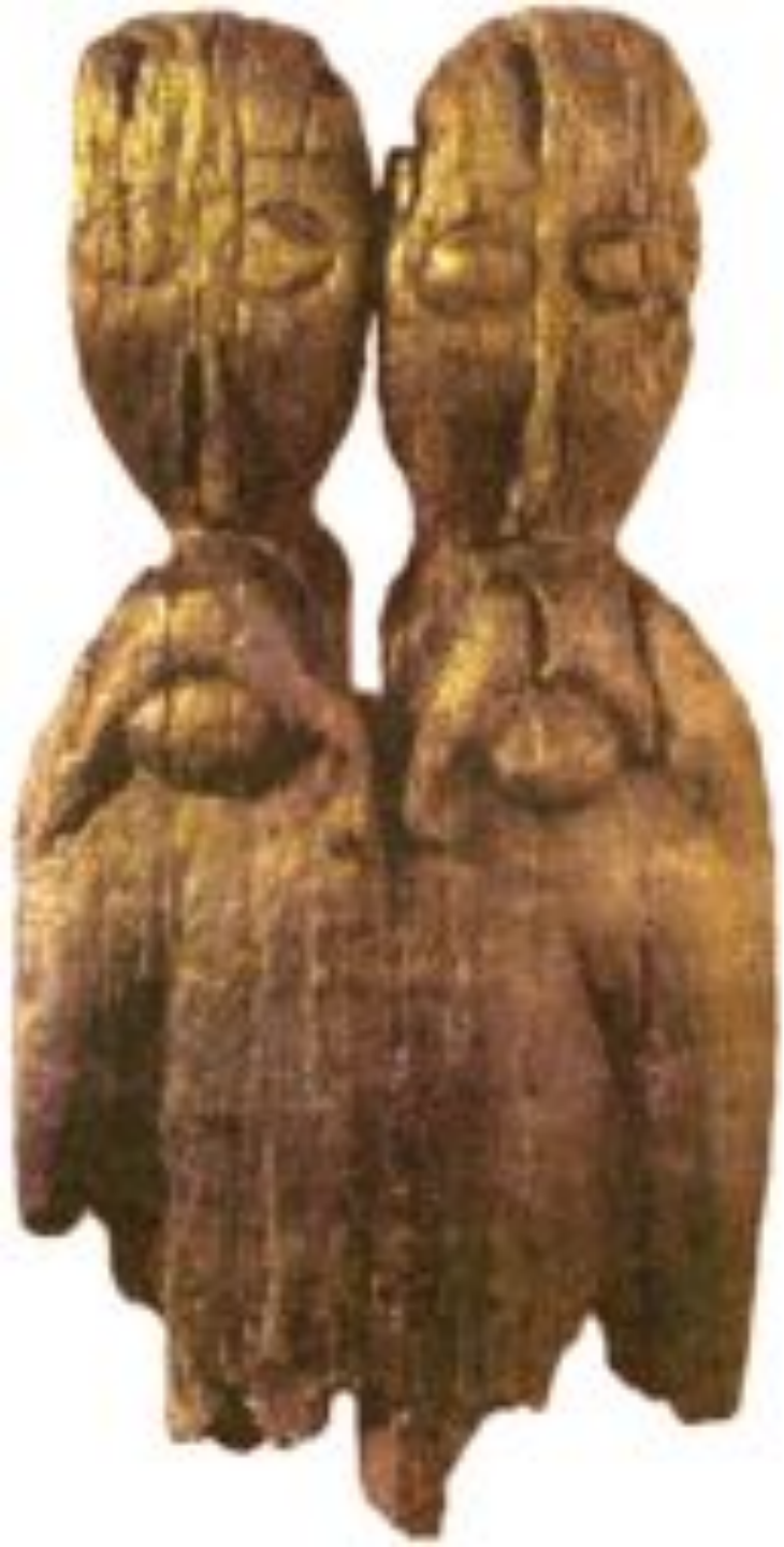
Западнославянский близнецный идол