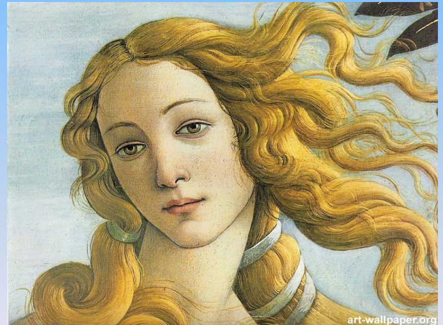
Боттичелли «Рождение Венеры»