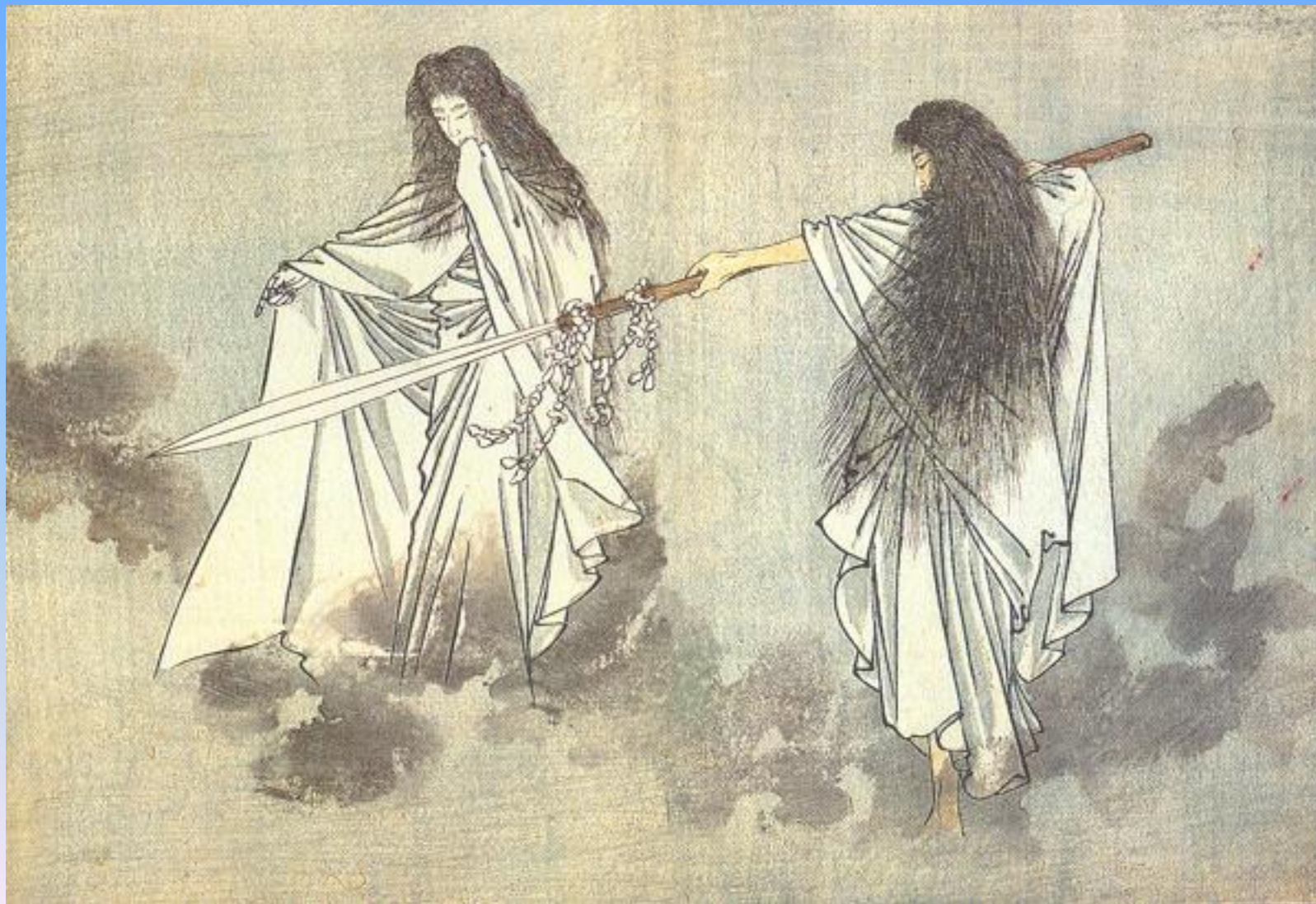
Идзанаги и Идзанами, боги- предтечи

Творение изображалось как «добывание» героем элементов культуры или как превращение хаоса в космос путем постепенного упорядочения.