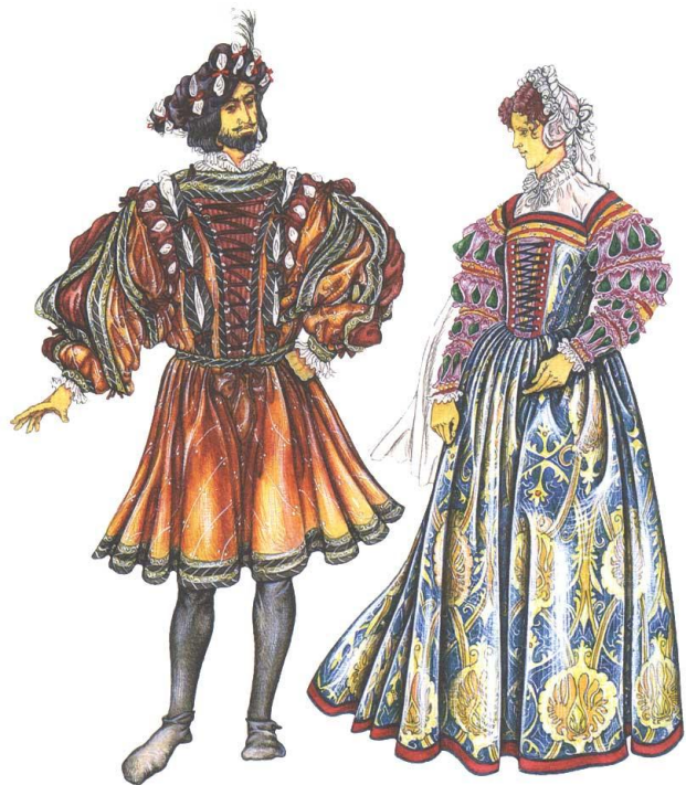
Испанская мода 16 века