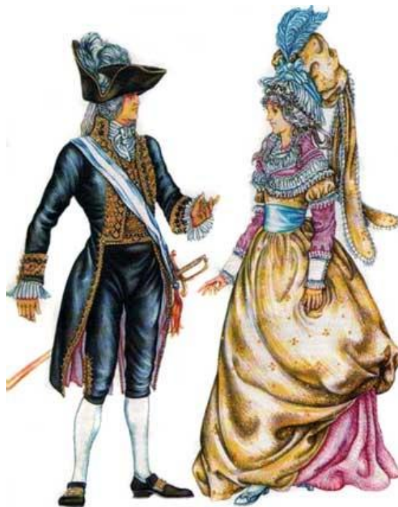
Костюм периода Великой Французской Революции.