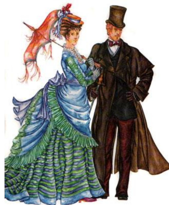
Западноевропейский костюм 19 века