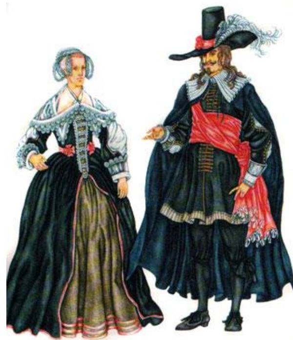
Костюм Голландии 17 века