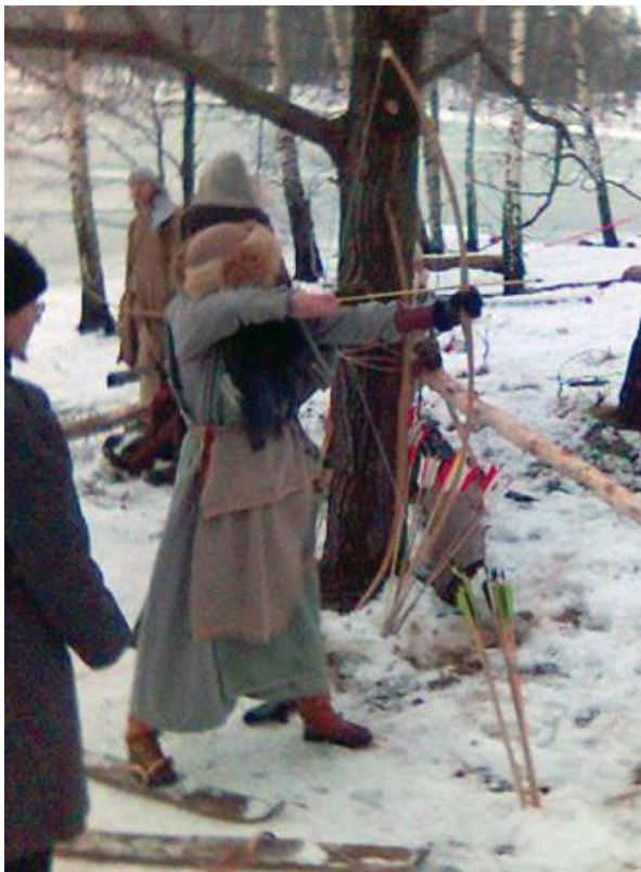
Зимняя одежда викинга