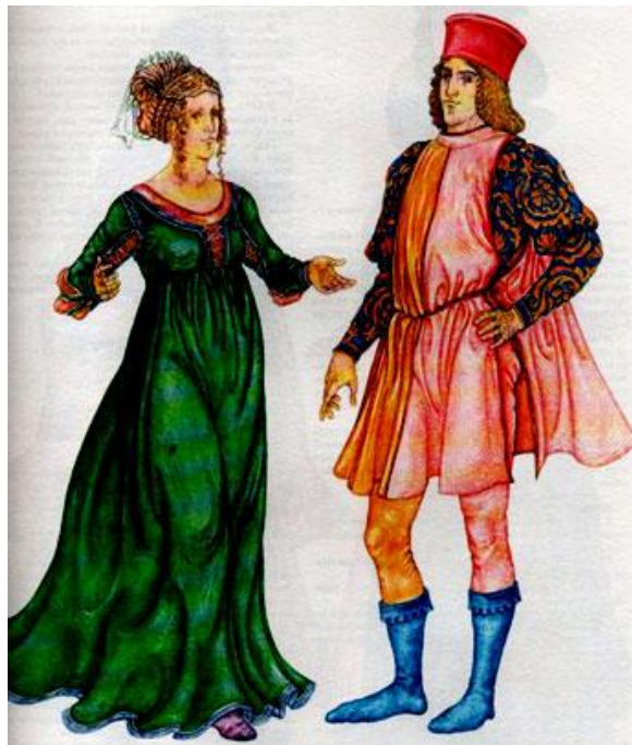
Костюм эпохи Возрождения Италия