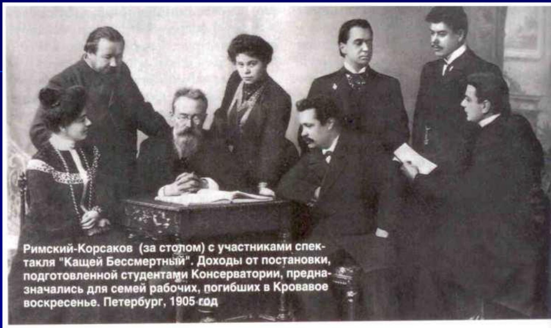
Римский-Корсаков (за столом) с участниками спектакля "Кашей Бессмертный". Доходы от постановки, подготовленной студентами Консерватории, предназначались для семей рабочих, погибших в Кровавое воскресенье. Петербург, 1905 год