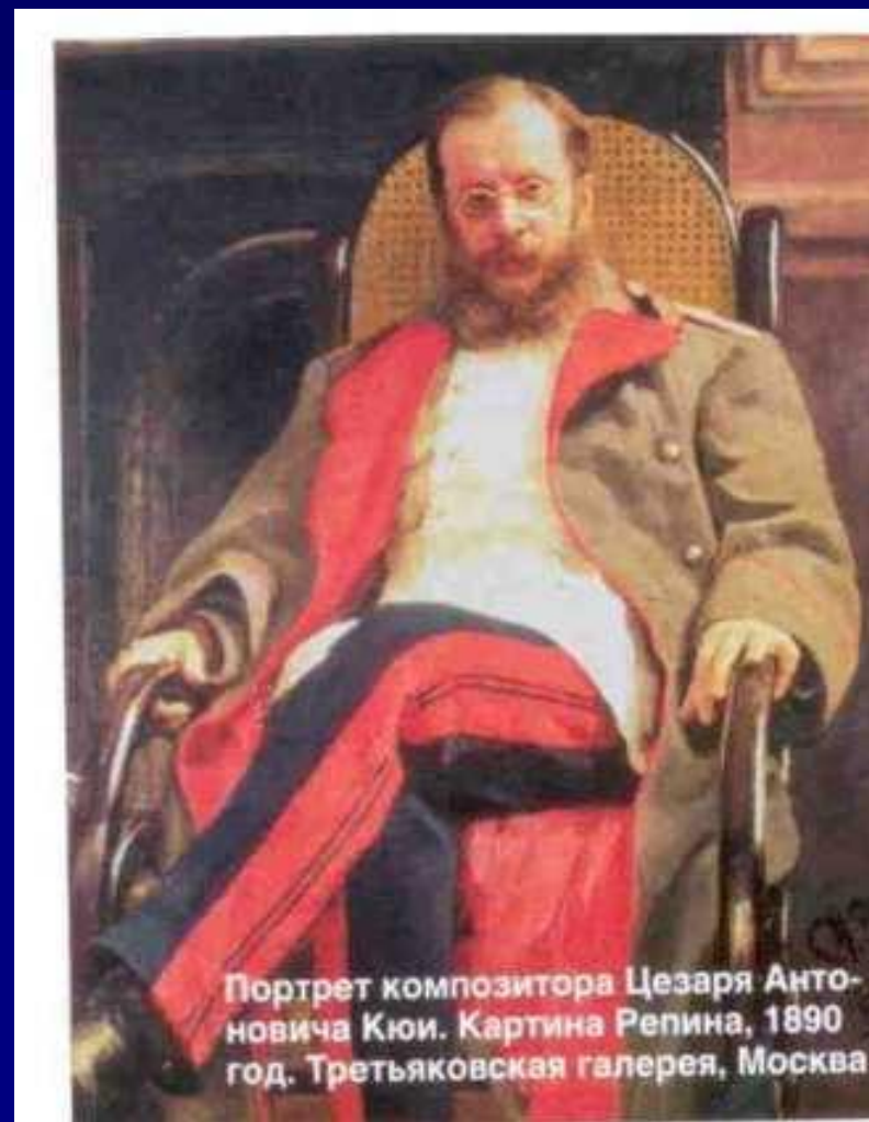
Портрет композитора Цезаря Антоновича Кюи. Картина Репина, 1890 год. Третьяковская галерея, Москва

Вообще-то Цезарь Антонович Кюи был на два года старше Балакирева. И к 1856г., когда юный музыкант только завоевывал столицу, он уже окончил солидную Инженерную академию. Кюи хорошо разбирался в музыке, играл на скрипке и фортепиано и даже пробовал сам писать. В его родном городе Вильно гармонией с ним занимался знаменитый польский композитор Станислав Монюшко.