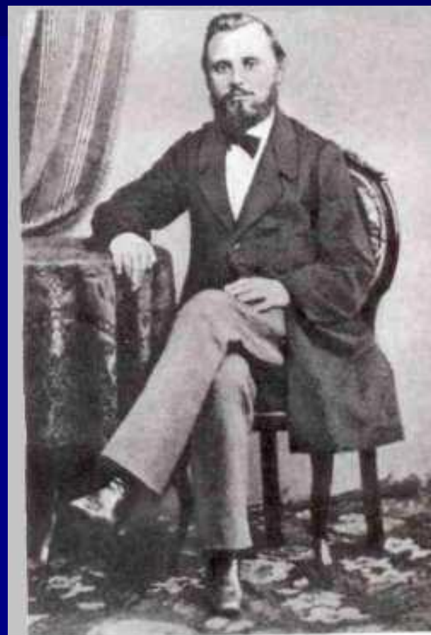
Милий Балакирев. Таким он был, когда создавался Балакиревский кружок. 1860-е годы