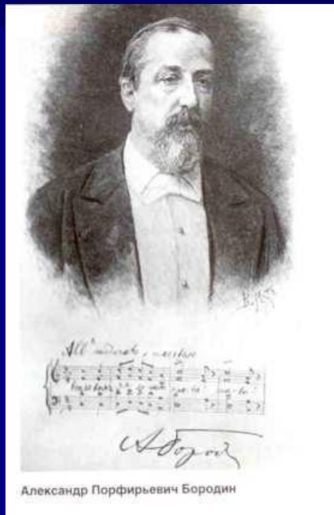
Александр Порфирьевич Бородин