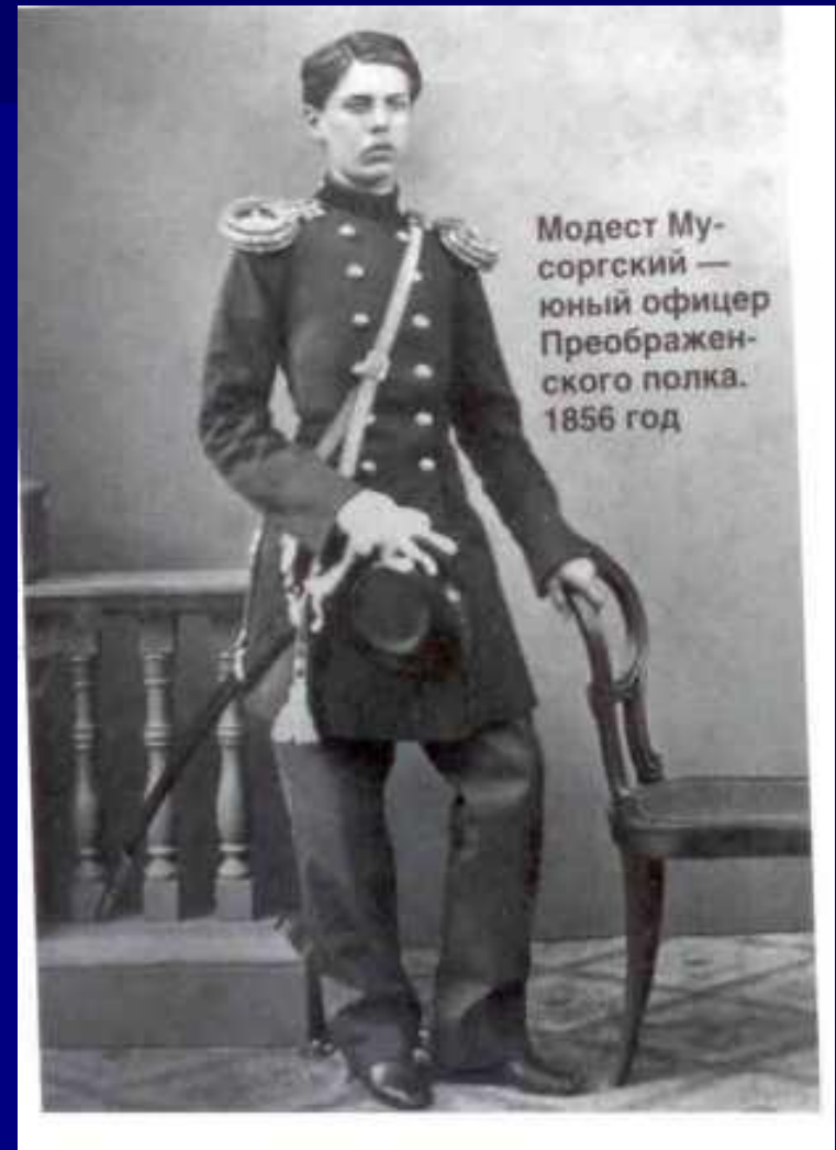
Модест Мусоргский — юный офицер Преображенского полка. 1856 год

А начиналось все идиллически – Мусоргский стал третьим постоянным участником балакиревских музыкальных вечеров. Случилось это в 1857г., когда будущему гениальному композитору было все лишь 17 лет. Родина его – село Карево на Псковщине. Русская глушь, где сам «дух народной жизни», как говорил Модест Петрович, сохранился в неприкосновенности. Первые музыкальные опыты Мусоргского проходили дома под руководством матери. Десяти лет от роду потомка старинного дворянского рода отвезли в Петербург, в Школу гвардейских подпрапорщиков.