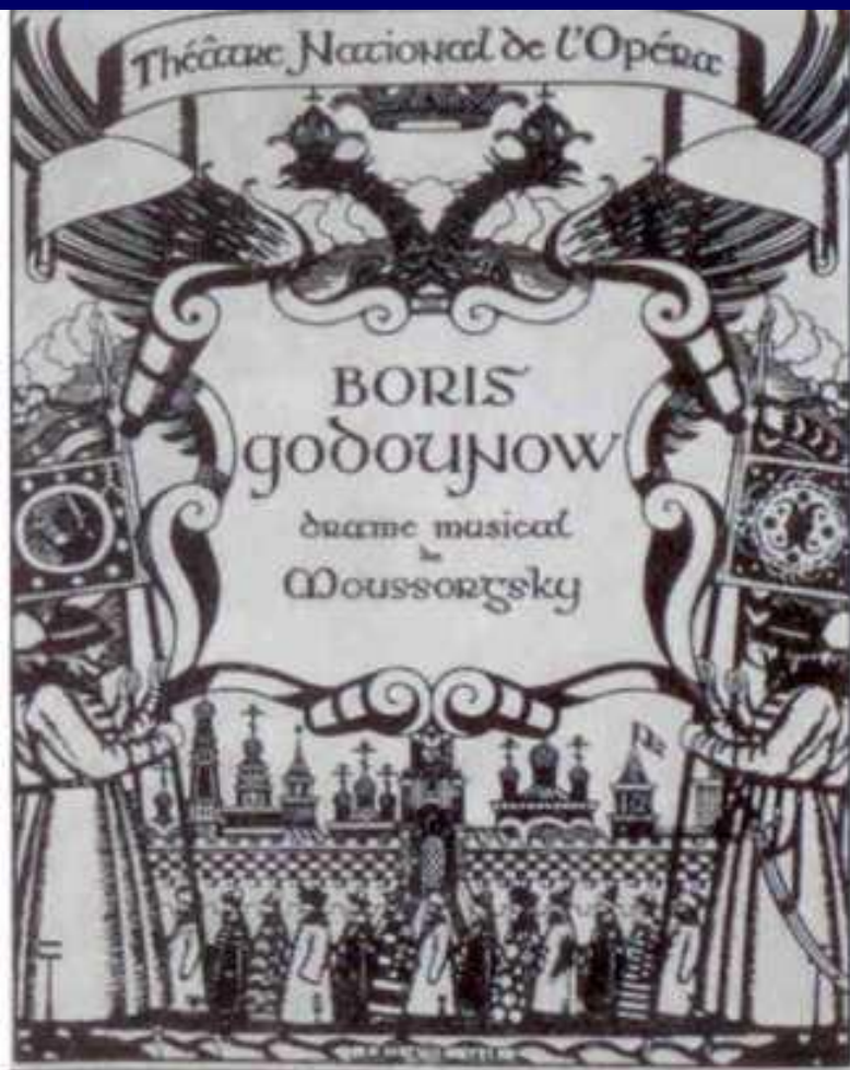
Обложка программы спектакля "Борис Годунов" для дягилевского "Русского сезона" 1908 года. Рисунок Ивана Билибина