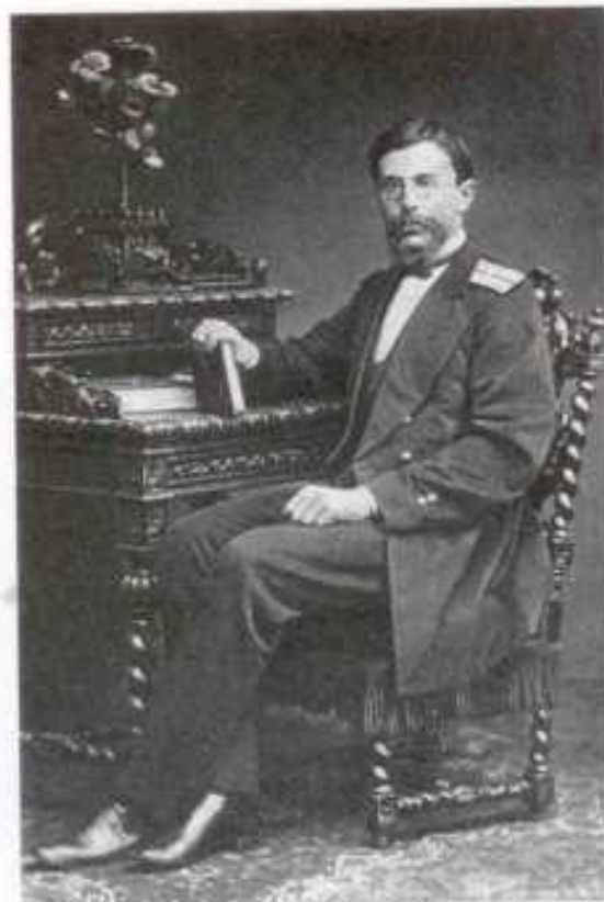
Счастливое семейство Римских-Корсаковых: Надежда Николаевна и Николай Андреевич. У них было семеро детей. Фото 1870-х годов

На одном из вечеров Римский-Корсаков знакомится с очаровательной пианисткой Надеждой Пургольд. Долгие романтические прогулки в окрестностях ее дачи в Парголово, совместное чтение и проигрывание музыкальных произведений... Николай Андреевич понимает: эта девушка – его судьба, пора делать ей предложение.