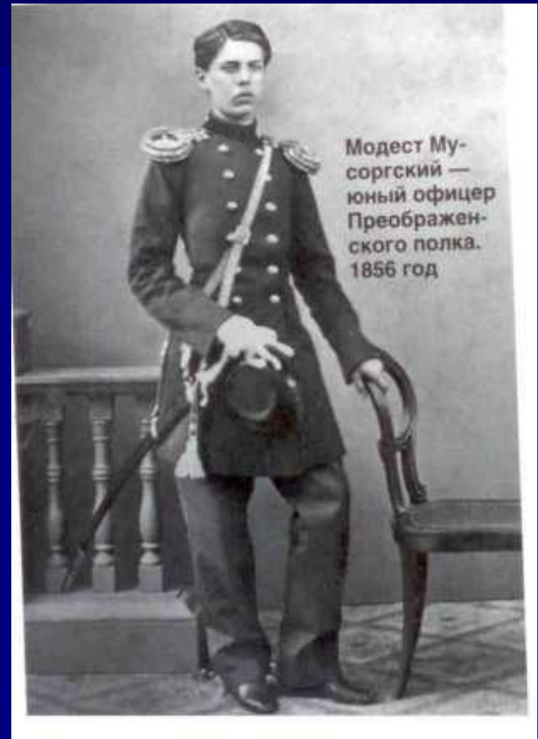
Модест Мусоргский — юный офицер Преображенского полка. 1856 год

А начиналось все идиллически – Мусоргский стал третьим постоянным участником балакиревских музыкальных вечеров. Случилось это в 1857г., когда будущему гениальному композитору было все лишь 17 лет. Родина его – село Карево на Псковщине. Русская глушь, где сам «дух народной жизни», как говорил Модест Петрович, сохранился в неприкосновенности. Первые музыкальные опыты Мусоргского проходили дома под руководством матери. Десяти лет от роду потомка старинного дворянского рода отвезли в Петербург, в Школу гвардейских подпрапорщиков.