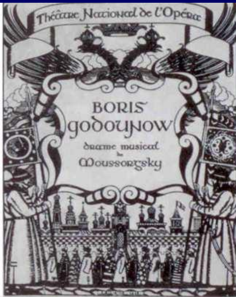
Обложка программы спектакля "Борис Годунов" для дягилевского "Русского сезона" 1908 года. Рисунок Ивана Билибина