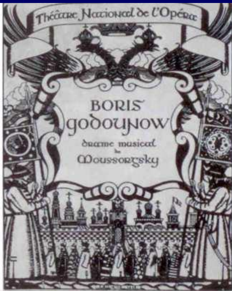
Обложка программы спектакля "Борис Годунов" для дягилевского "Русского сезона" 1908 года. Рисунок Ивана Билибина