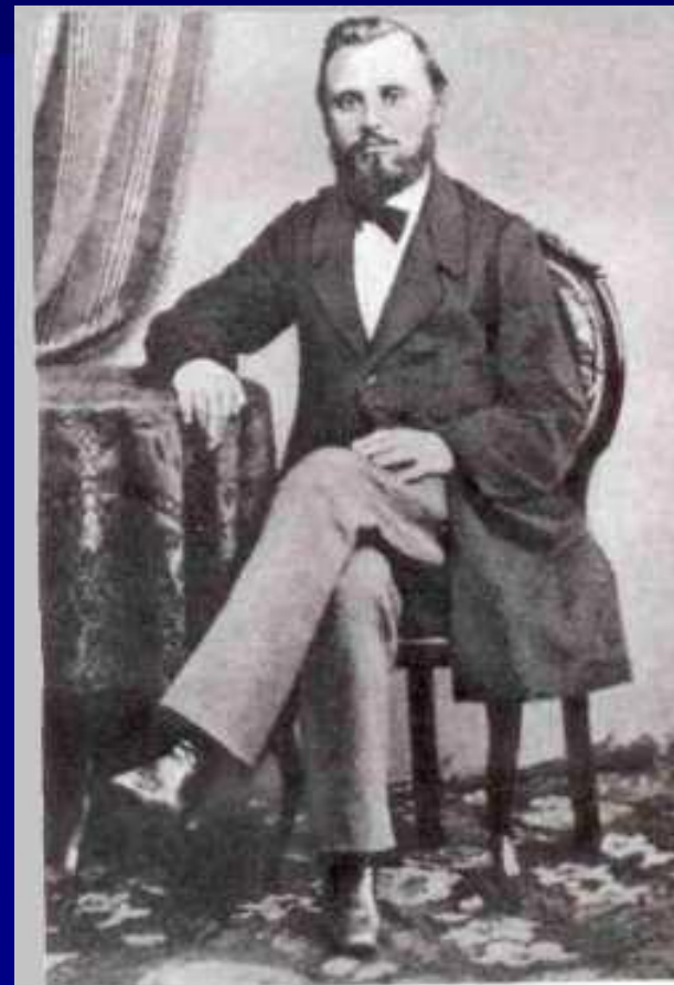
Милий Балакирев. Таким он был, когда создавался Балакиревский кружок. 1860-е годы