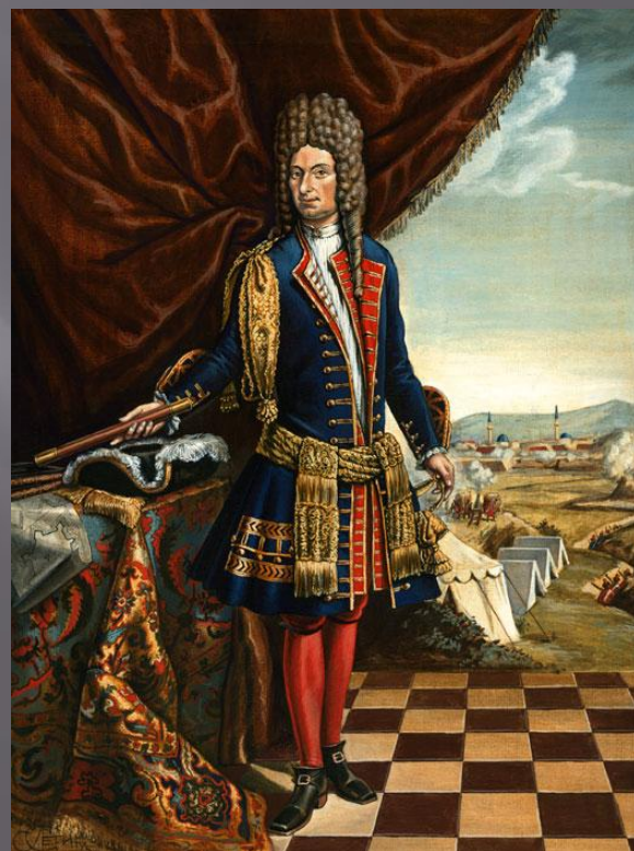
Франц Яковлевич Лефорт