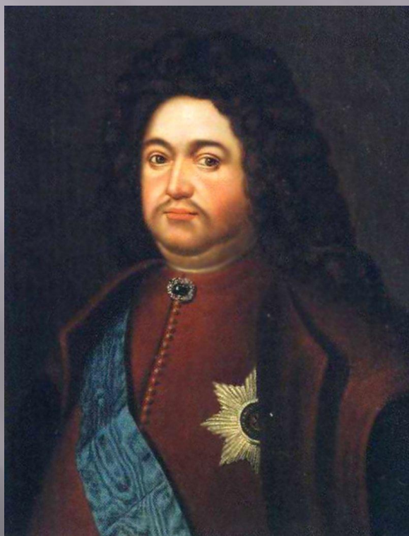
Фёдор Алексеевич Головин