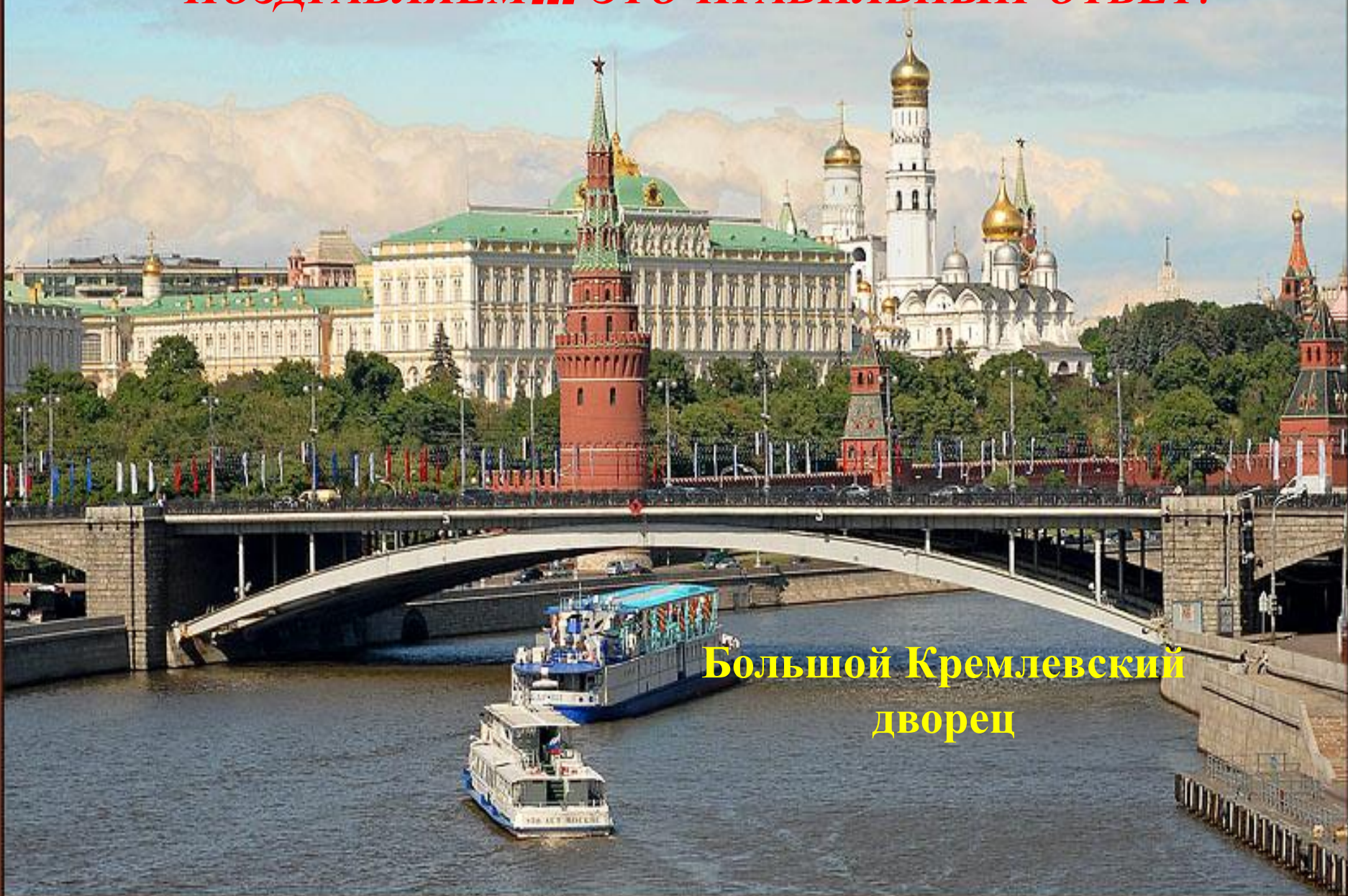
Большой Кремлевский дворец