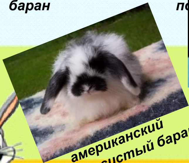
американский ворсистый баран