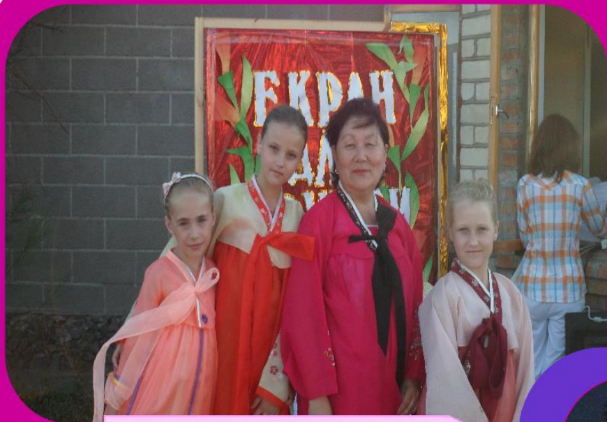
Фестиваль "Екран дружби" Сел. Штормове, АР Крим 03.07.2012

Пісні та танці своїх народів представляли українці, росіяни, поляки, африканці, татари, корейці, пакистанці.