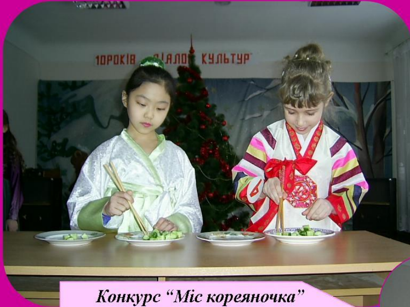
Конкурс "Міс корейночка" ХСШ №181 "Дьонсурі" 02.03.2013

На конкурсі дівчатка презентують свої знання корейської культури, кухні.