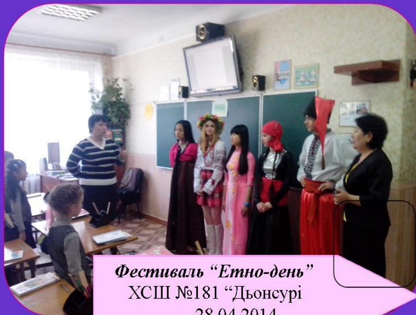
Фестиваль “Етно-день” ХСШ №181 “Дьонсурі” 28.04.2014

Старшокласники різних національностей в “Етно-день” прийшли в своїх національних костюмах та представляли свої культурні традиції в молодшій та середній школі.