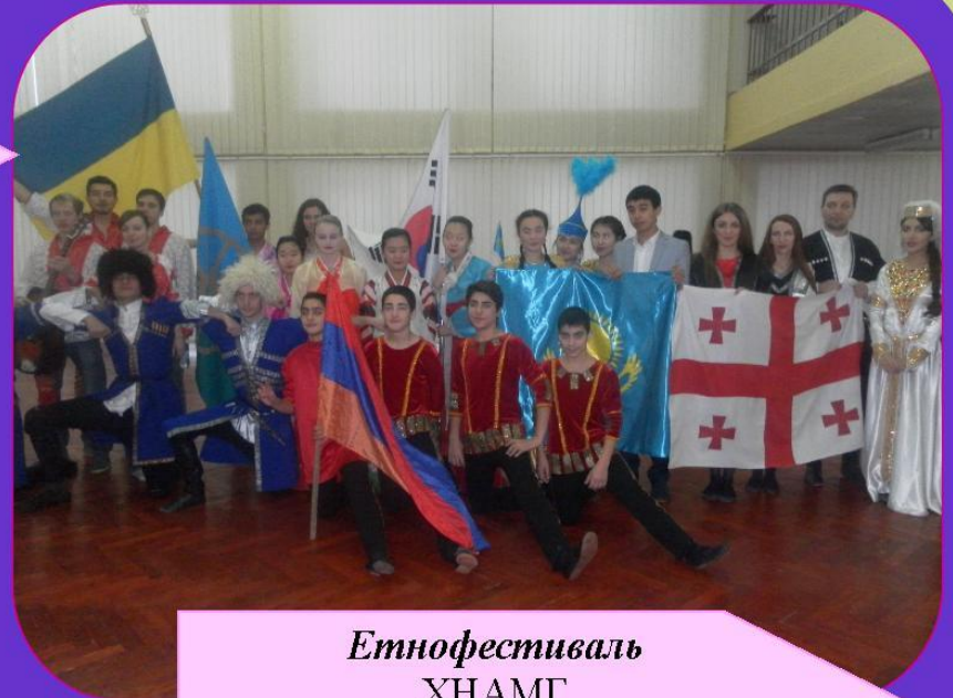
Етнофестиваль ХНАМГ 04.12.2013

Клуб “Мугунхва” представив школу на Етнофестивалі в Харківській національній академії міського господарства