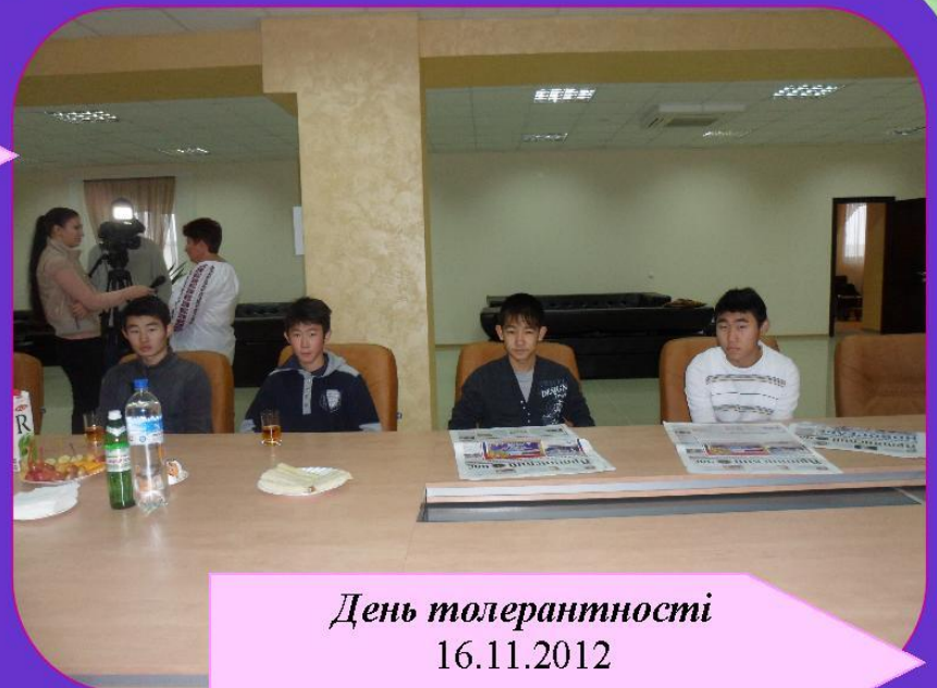
День толерантності 16.11.2012

День толерантності проходить щороку за підтримки Харківської обласної державної адміністрації