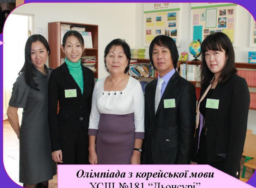
Олімпіада з корейської мови ХСШ №181 "Дьонсурі" 30.11.2013

Учні різних національностей приймають в ній участь та займають призові міста