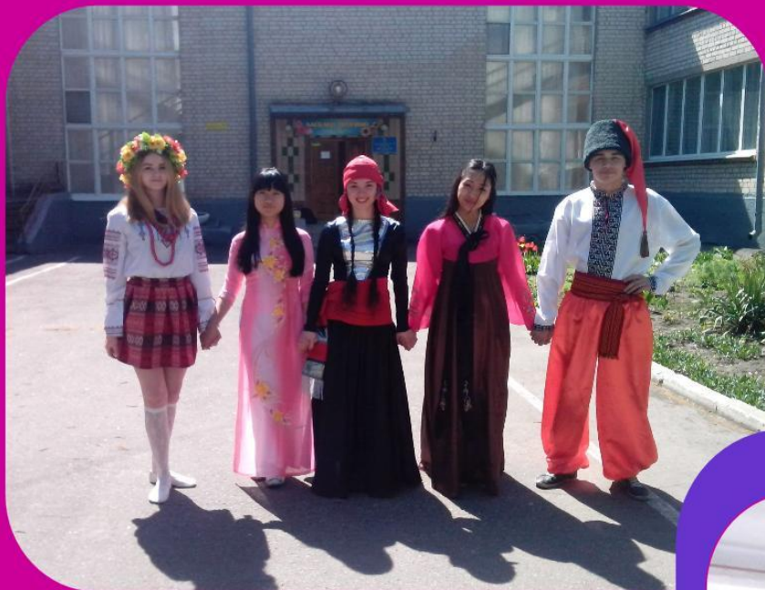
Фестиваль “Етно-день” ХСШ №181 “Дьонсурі” 28.04.2014

Старшокласники різних національностей в “Етно-день” прийшли в своїх національних костюмах та представляли свої культурні традиції в молодшій та середній школі.