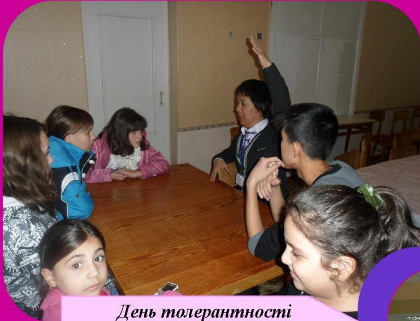
День толерантності 16.11.2012

День толерантності проходить щороку за підтримки Харківської обласної державної адміністрації