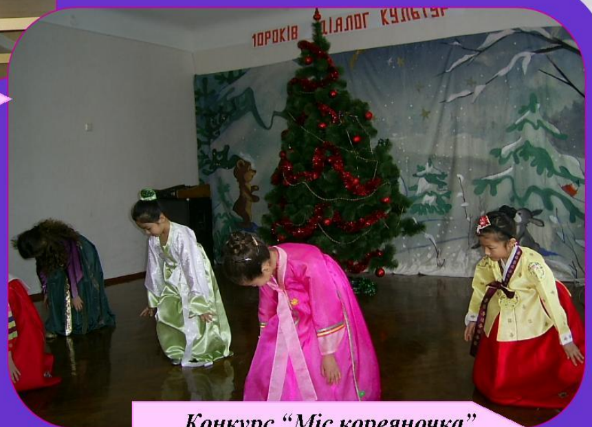
Конкурс "Міс корейночка" ХСШ №181 "Дьонсурі" 02.03.2013

З першого класу учні вивчають корейську культуру. Учениці молодших класів щорічно приймають участь в конкурсі "Міс корейночка"