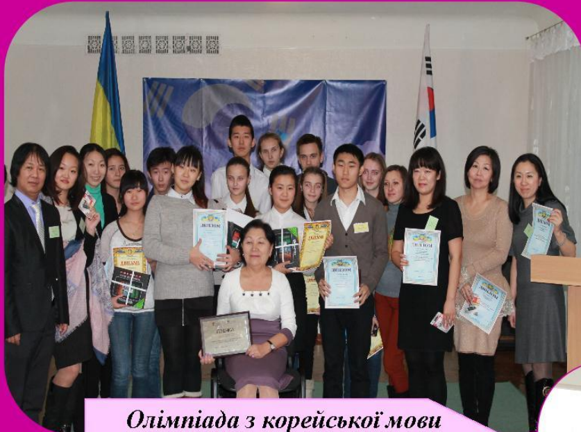
Олімпіада з корейської мови ХСШ №181 "Дьонсурі" 30.11.2013

Щорічна олімпіада з корейської мови вже протягом 4 років проходить в нашій школі.