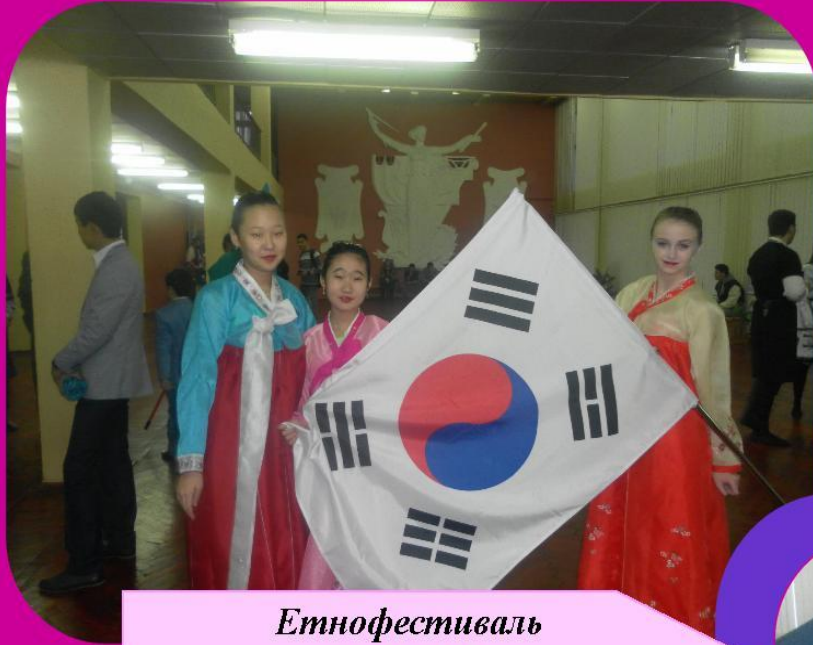
Етнофестиваль ХНАМГ 04.12.2013

Клуб “Мугунхва” представив школу на Етнофестивалі в Харківській національній академії міського господарства