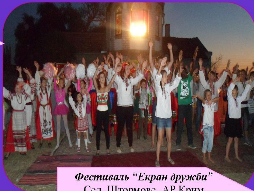
Фестиваль "Екран дружби" Сел. Штормове, АР Крим 03.07.2012

Наші учні 5 років поспіль приймаються участь в Міжетнічному фестивалі "Екран дружби", який проходить в Криму. Кожен з учасників знайомить інших з культурою та звичаями свого народу.