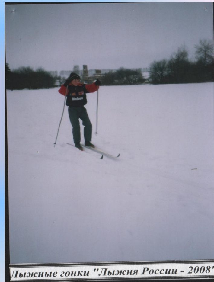
Лыжные гонки "Лыжня России - 2008"