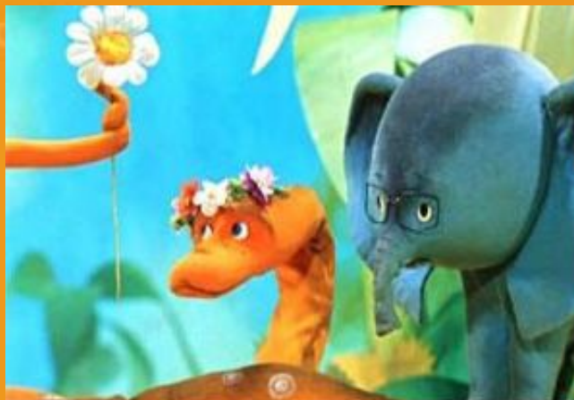
Кадр из мультфильма «38 попугаев»