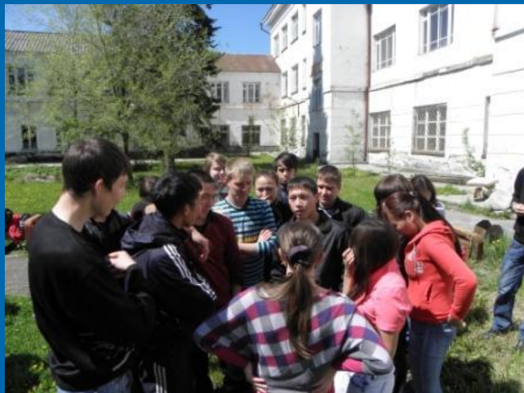
1 курс «Лувреаты»