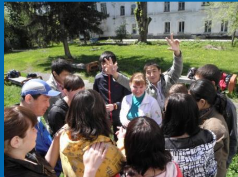
2 курс «Искатели»