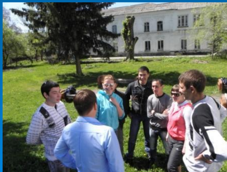
3 курс «Хранители»