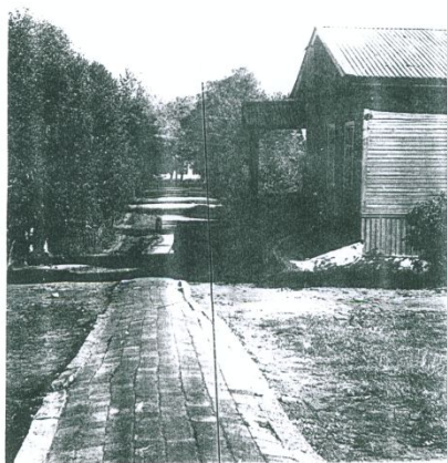
4-ое здание школы № 2 сентябрь 1977