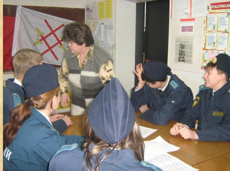
Последние наставления классного руководителя перед викториной