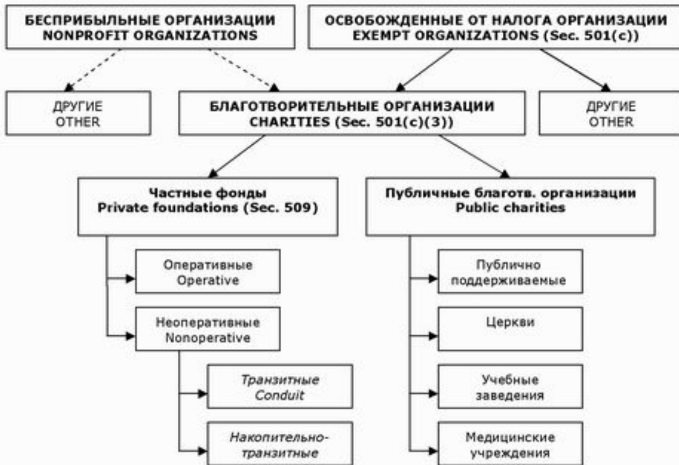
Благотворительные организации в США. Упрощенная схема