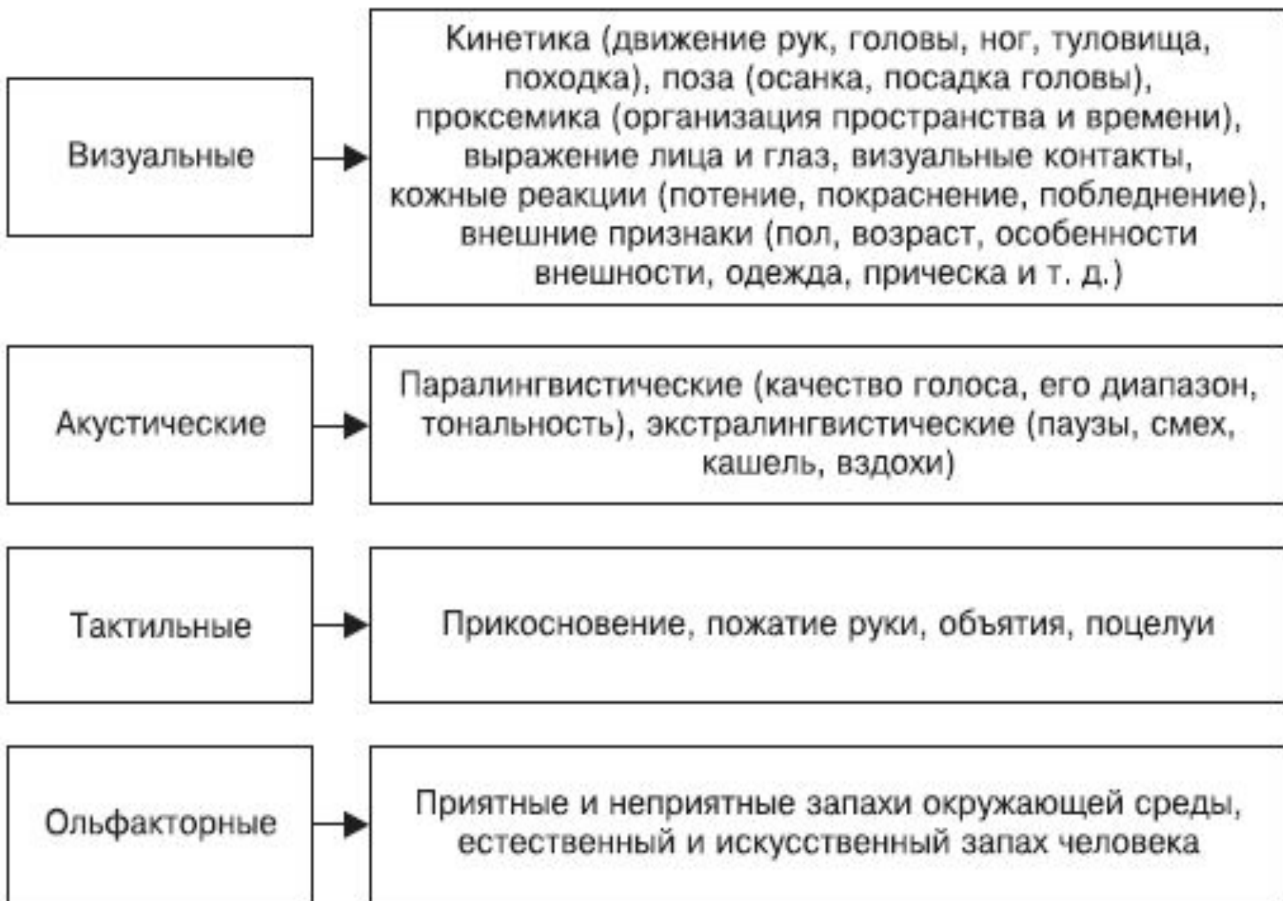
Рис. 3.3. Виды невербальных средств общения