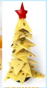
елочка из сыра