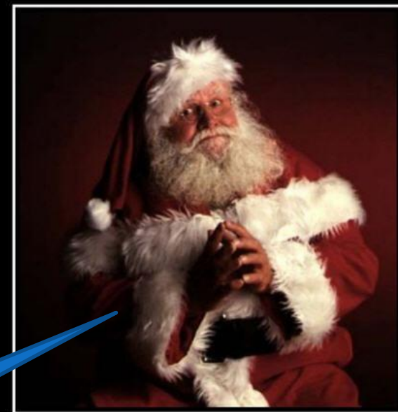
DEAR CHILDREN One Day You Will Learn Everything About Santa Claus. On That Day Remember Everything The Adults Have Told You About Jesus.